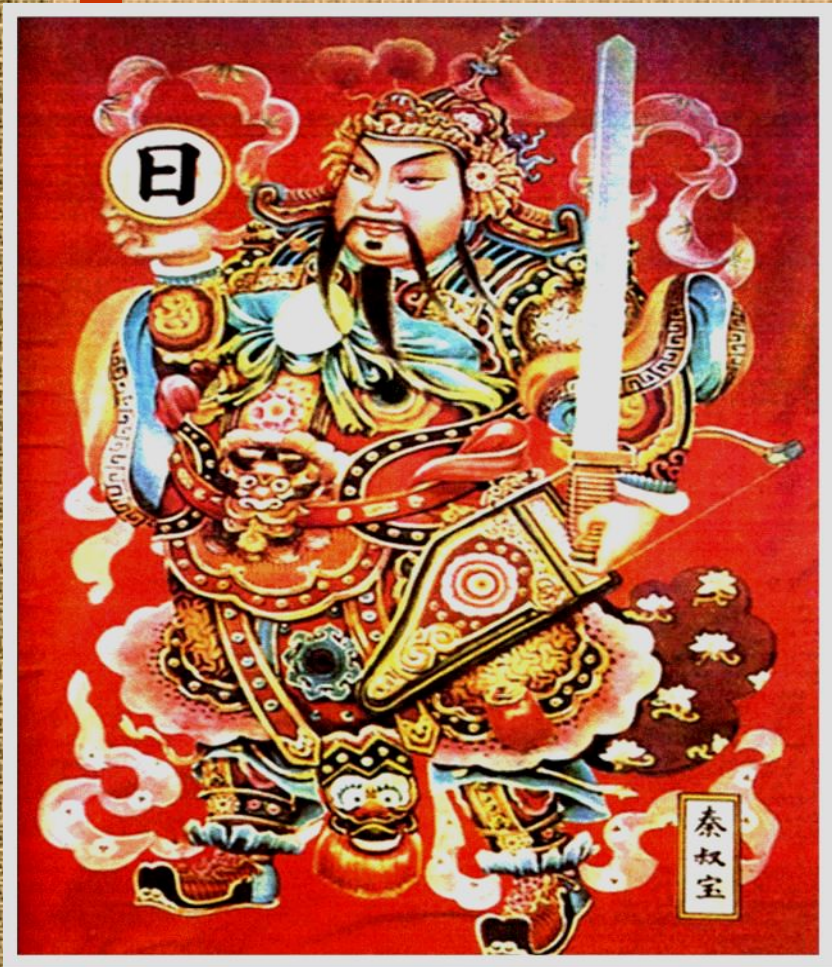
Цинь Шихуань. Древнекитайский рисунок по шелку.

До 3 в. до н.э. в Китае существовало 7 царств.