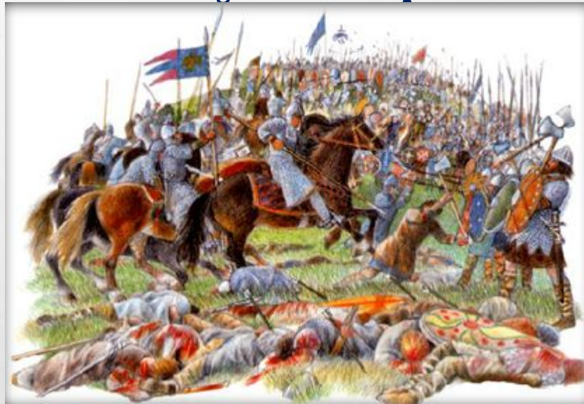
Битва при Гастингсе

В 1066 году Вильгельм, герцог Нормандии, переправился через Ла-Манш и 28 сентября высадился со