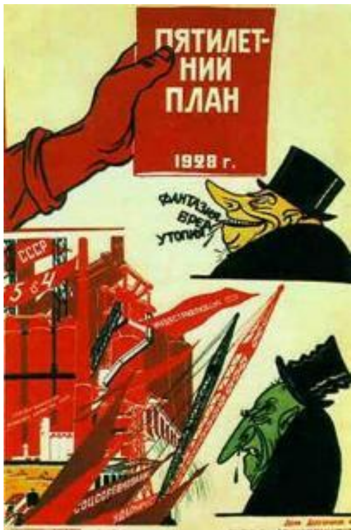
В.Дени, Н.Долгоруков. Первый пятилетний план.