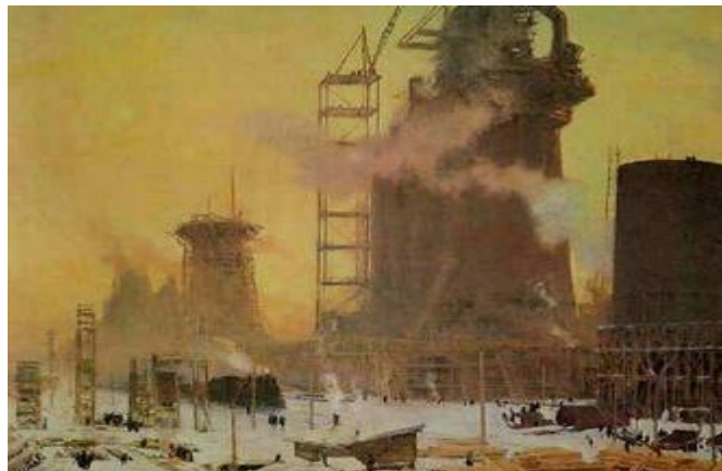
Я. Ромас. Утро Первой Пятилетки.