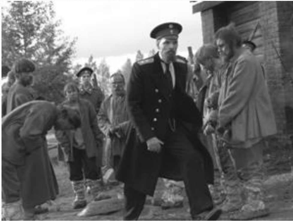
Столыпин осматривает хуторское хозяйство.