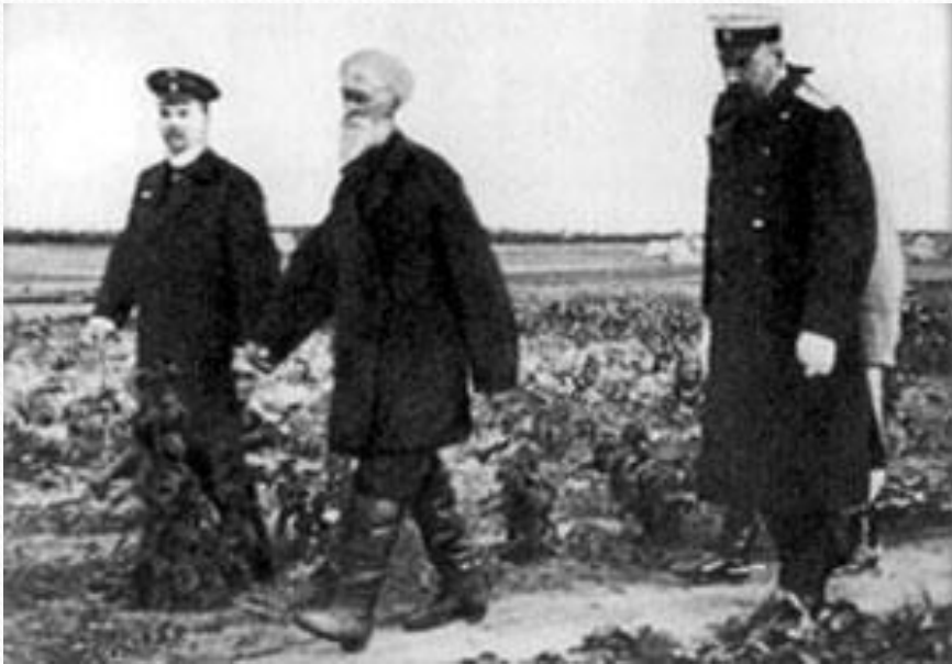
П.А.Столыпин осматривает хуторские огороды близ Москвы в апреле 1910 г