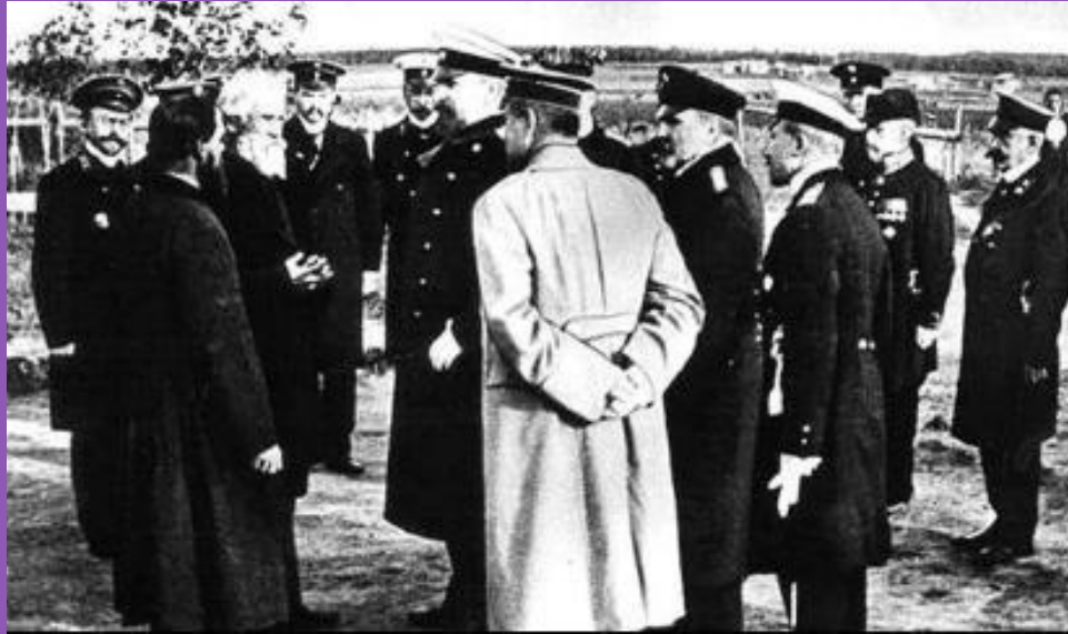
П Столыпин в гостях у кулака.

● Это вновь привело к началу промышленного подъема (1909-13 гг. - 9% в год). Крестьянство пошло по своему пути в отличие от американцев оно стало объединяться в кооперативы , которые активно работали как на внутреннем, так и на внешнем рынке. В 1912г. был создан Московский народный банк кредитовавший крестьян для покупки техники, семян, удобрений и др.