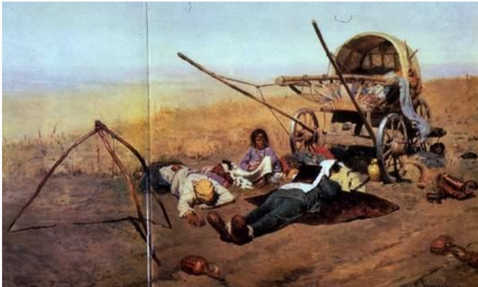
«В дороге...смерть переселенца»