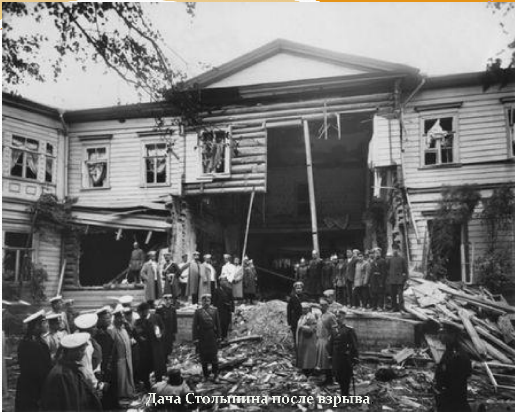
Дача Столыпина после взрыва.