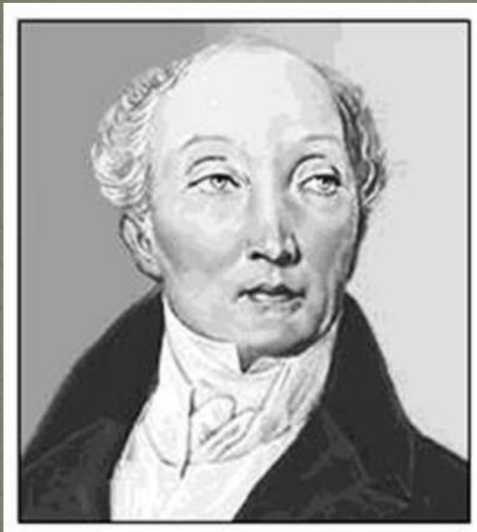
Михаил Михайлович Сперанский

Реформы, проводимые Сперанским, затронули практически все слои российского общества. Это вызвало бурю недовольных возгласов со стороны дворянства и чиновничества, чьи интересы были затронуты более всего. Всё это отрицательно сказалось на положении самого государственного советника. Просьбу об отставке в феврале 1811 г. Александр I не удовлетворил, и Сперанский продолжил работу. Но дальнейшее течение дел и времени приносило ему все новых и новых недоброжелателей. В последнем случае Михаилу Михайловичу припомнили Эрфурт и встречи с Наполеоном. Этот упрек в условиях обострившихся российско-французских отношений было особенно тяжелым. Интрига всегда играет большую роль там, где существует режим личной власти. К самолюбию прибавлялась в Александре чрезвычайная боязнь насмешки над собой. Если кто-либо засмеется его присутствию, на него посматривая, Александр тут же начинал думать, что это над ним смеются. В случае со Сперанским противники реформ выполнили такую задачу блестяще.