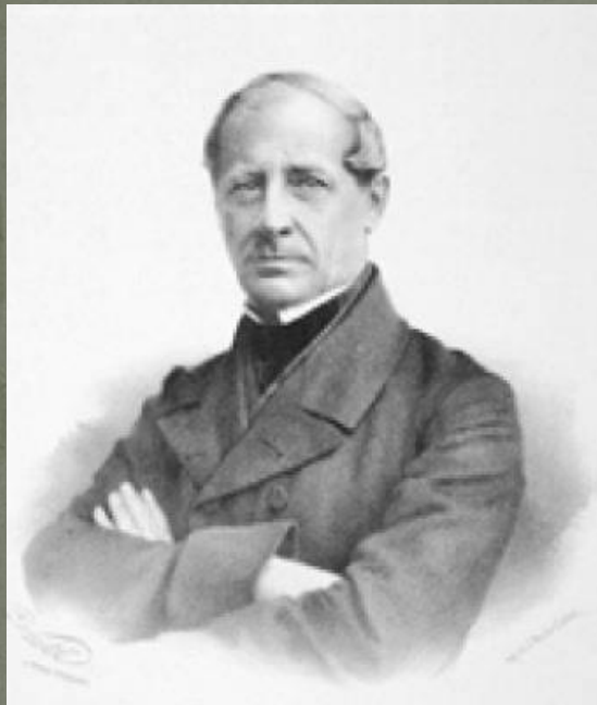
М. А. Корф

Неоднократно слышал их, по-видимому, и государь. Однако взгляды были сконцентрированы в одном документе, написанном живо, ярко, убедительно, на основе исторических фактов и человеком, не близким ко двору, не облеченным властью, которую боялся бы потерять. Эта записка Карамзина сыграла решающую роль в отношении к Сперанскому. Вместе с тем самоуверенность самого Сперанского, его неосторожные упреки в адрес Александра I за непоследовательность в государственных делах, в конечном итоге переполнили чашу терпения и вызвали раздражение императора. Из дневника барона М. А. Корфа. Запись от 28 октября 1838 года: «Отдавая полную высокую справедливость его уму, я никак не могу сказать того же об его сердце. Я разумею здесь не частную жизнь, в которой можно его назвать истинно добрым человеком, ни даже суждения по делам, в которых он тоже склонен был всегда к добру и человеколюбию, но то, что называю сердцем в государственном или политическом отношении — характер, прямоту, непоколебимость в избранных однажды правилах. Сперанский не имел... ни характера, ни политической, ни даже частной правоты». Многим своим современникам Сперанский показался именно таким, каким обрисован он главным своим биографом в только что приведенных словах.