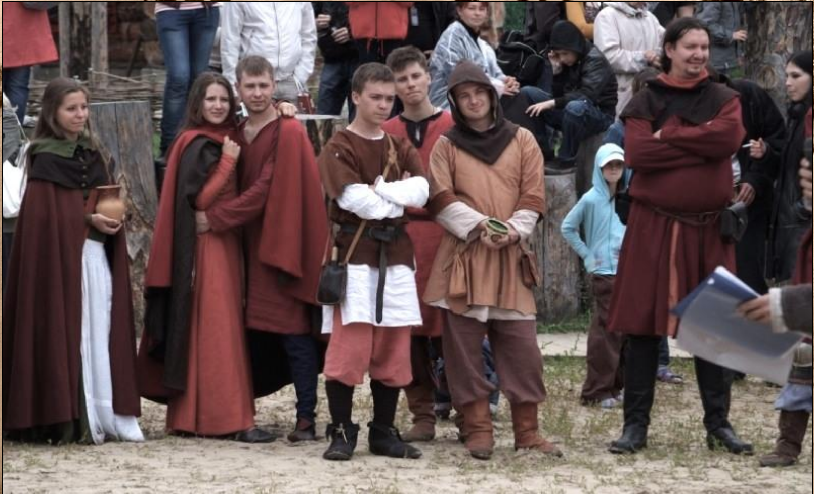
горожане, историческая реконструкция