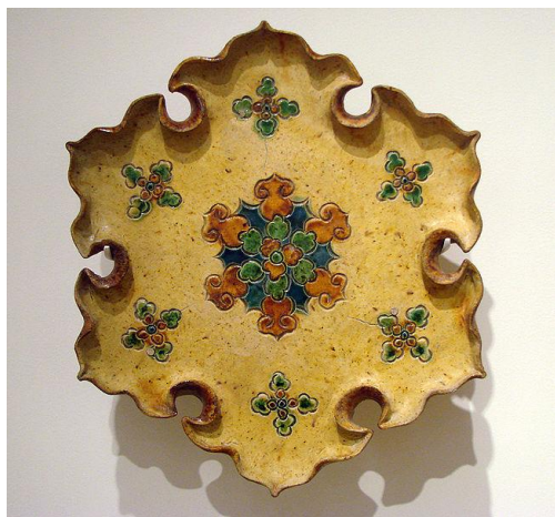
Изделие Династии Тан (618 - 906 гг. н.

История развития фарфора в Китае насчитывает тысячелетие. Точная дата возникновения неизвестна. Некоторые источники относят возникновения фарфора в Китае к династии Хань (206-221гг. н.э.), Эпохе Троецарствия (220-280гг. н.э.), периоду Шести династий (220-589гг. н.э.) и династии Тан (618-906гг. н.э.)