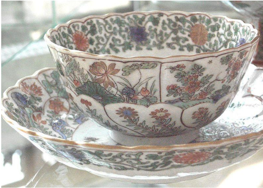
Посуда, в стиле династии Цин

Для изготовления китайского фарфора применялись: