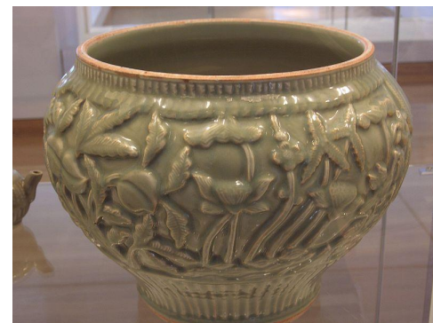
Сосуд конца династии Юань, на стенках изображения персиков, лотосов, пионами, ивы и пальмы.