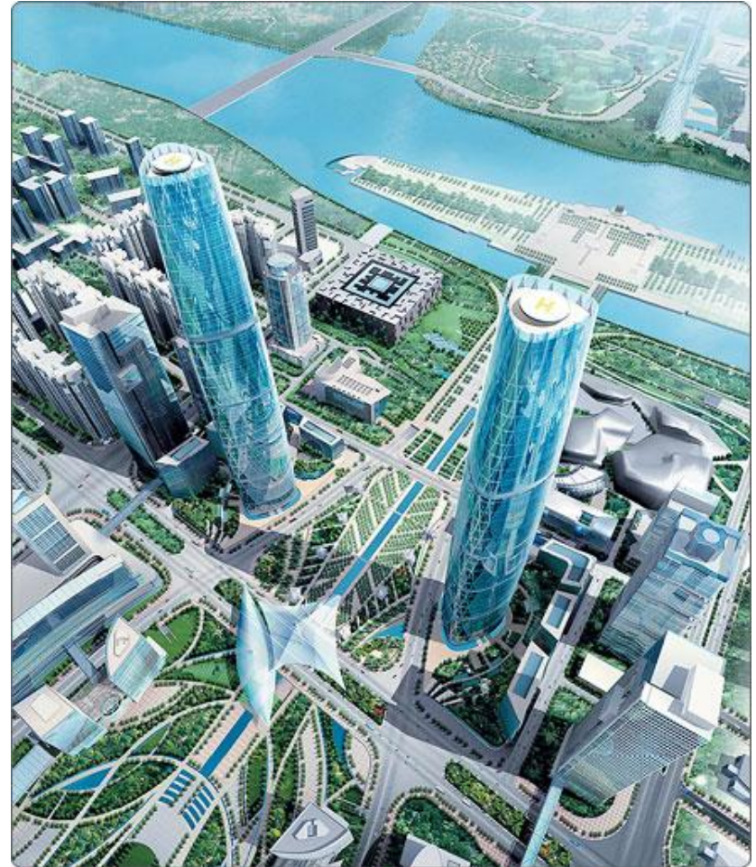
Современный город Гуанчжоу

Крестьянская война 874—884гг. в Китае под предводительством Хуан Чао, одно из крупных антифеодалных народных выступлений, вызванных усилившимся во 2-й половине 9 в. процессом обезземеливания китайского крестьянства.