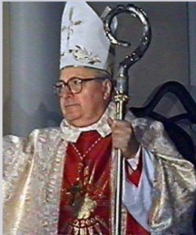
Западная (католическая) церковь