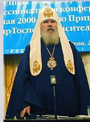
Восточная (православная) церковь