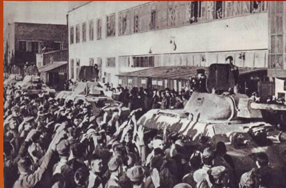
Танки с завода уходят на фронт

Сталинградский тракторный приступил к выпуску танковых моторов, артиллерийских тягачей и средних танков Т-34.