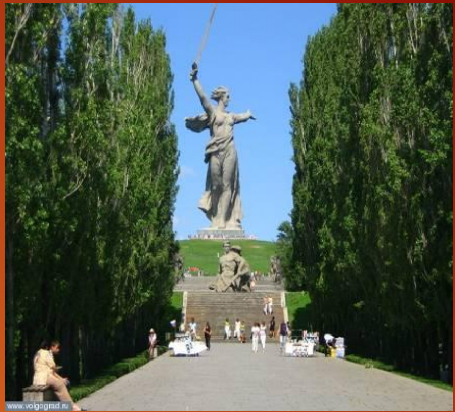
Мемориальный комплекс на Мамаевом кургане (современный вид)

Бои за курган начались 14 сентября 1942 года.