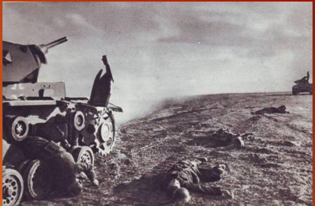
Атака немецких танков отбита