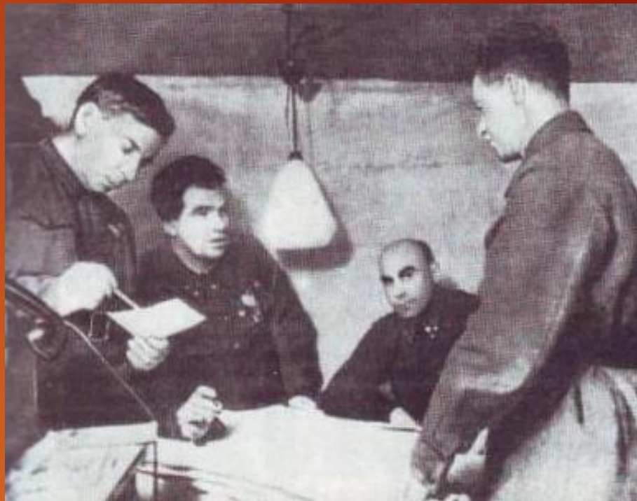
В штабе 62-й армии: Н.И.Крылов, В.И. Чуйков, К.А.Гуров, А.И.Родимцев

17 июля 1942 года передовые части фашистской группы армий «Б» в большой излучине Дона встретились с войсками Сталинградского фронта. Началась Сталинградская битва.