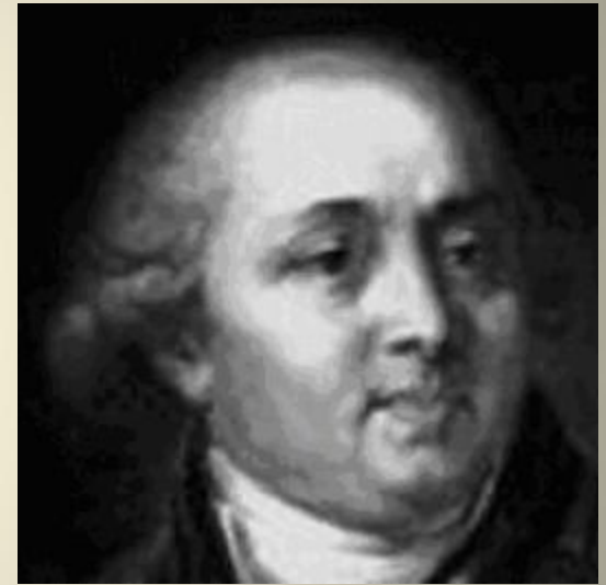
СТАРОВ Иван Егорович русский архитектор