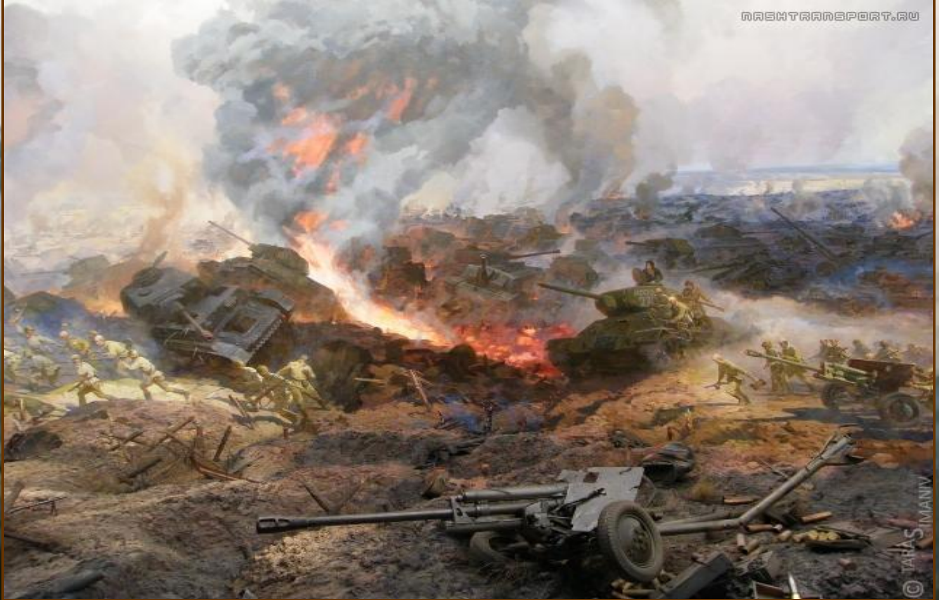
Курская дуга «Цитадель» - 05.07.-23.08. 1943г. Танковое сражение, коренной перелом в войне.