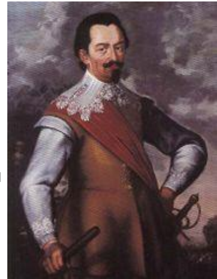
Альбрехт фон Валленштейн