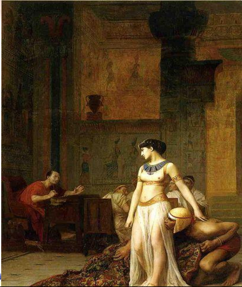
Клеопатра и Цезарь

Прославлена благодаря истории любви к римскому полководцу Марку Антонию. В годы её правления Египет был покорён Римом, сама Клеопатра покончила жизнь самоубийством, чтобы не стать пленницей первого римского императора Октавиана Августа.