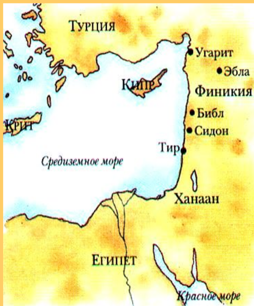
Финикия во 2 тыс. до н.э.

На восточном побережье Средиземного моря в 3-2 тыс. до н.э. возникли города финикийцев.