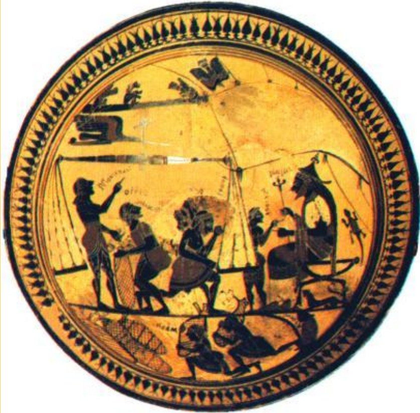
Разгрузка торгового корабля.