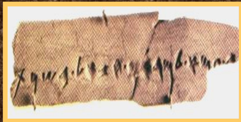
Образцы финикийского письма.

При создании своего алфавита финикийцы использовали опыт египтян и вавилонян. Алфавит состоял из 22 букв, обозначающих только согласные звуки.