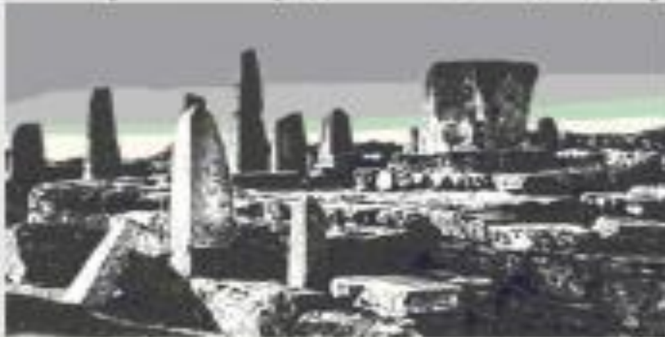
«Храм обелисков» в Библе, 1900 г. до н.э.