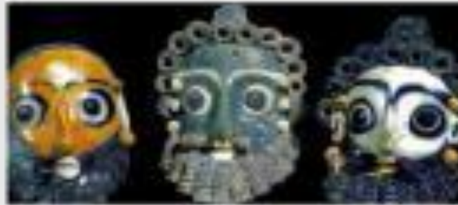
Финикийские маски из цветного стекла