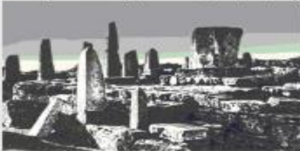
«Храм обелисков» в Библе, 1900 г. до н.э.