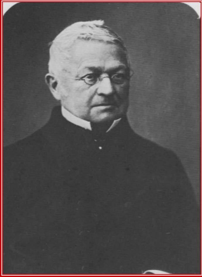
Адо́льф Тье́р – президент Третьей Французской республики (1871-1877)