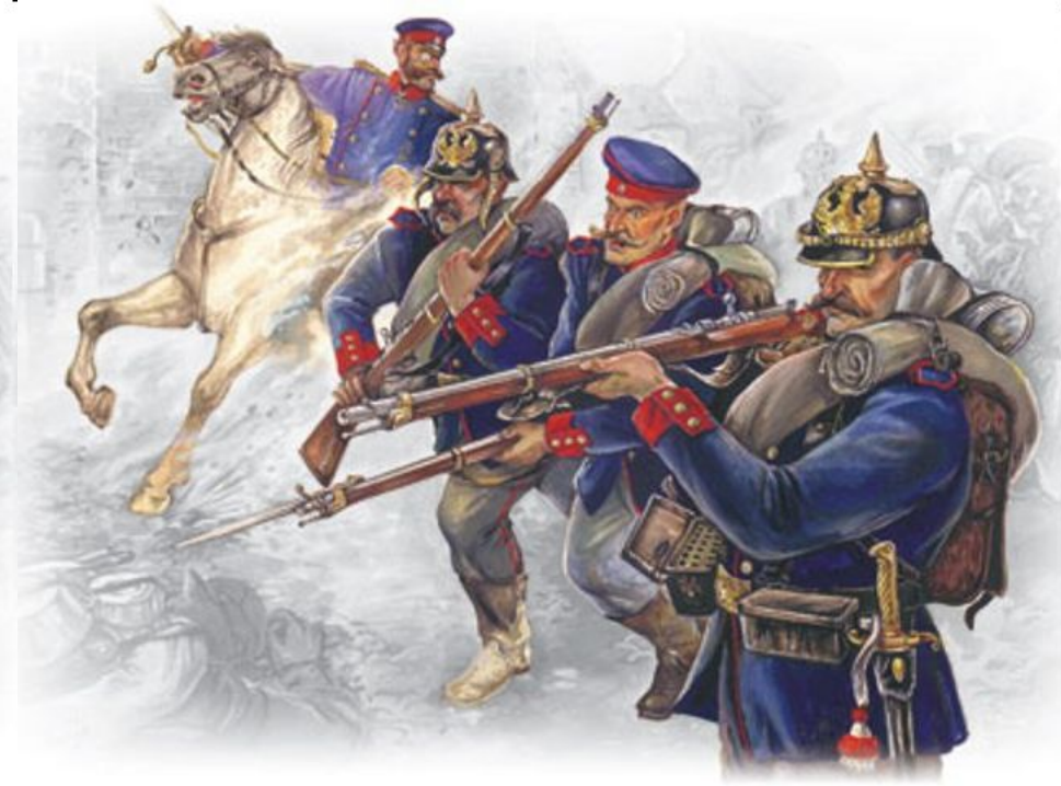
Прусская линейная пехота