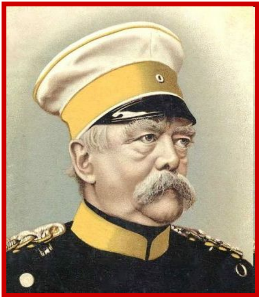
Канцлер Пруссии Отто фон Бисмарк

Бисмарк , считавший с 1866 г. войну с Францией неизбежной, тоже желал скорейшего начала войны и искал повод . Но, будучи опытным дипломатом, прусский канцлер хотел , чтобы Франция первая развязала войну , так как ее нападение должно было вызвать общенациональное демократическое движение за ускорение полного объединения Германии: южные немецкие государства могли добровольно встать под прусские знамена .