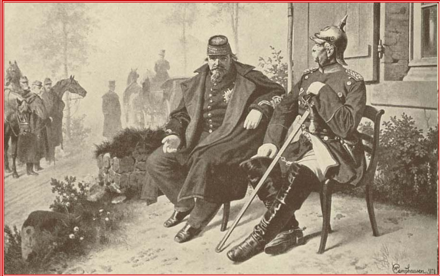
Франко-прусская война, плен и низложение.