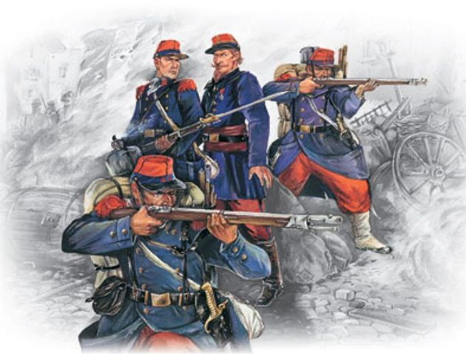
Французская линейная пехота