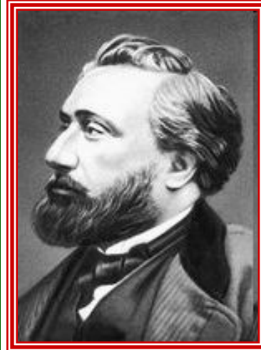
Император Франции Наполеон III