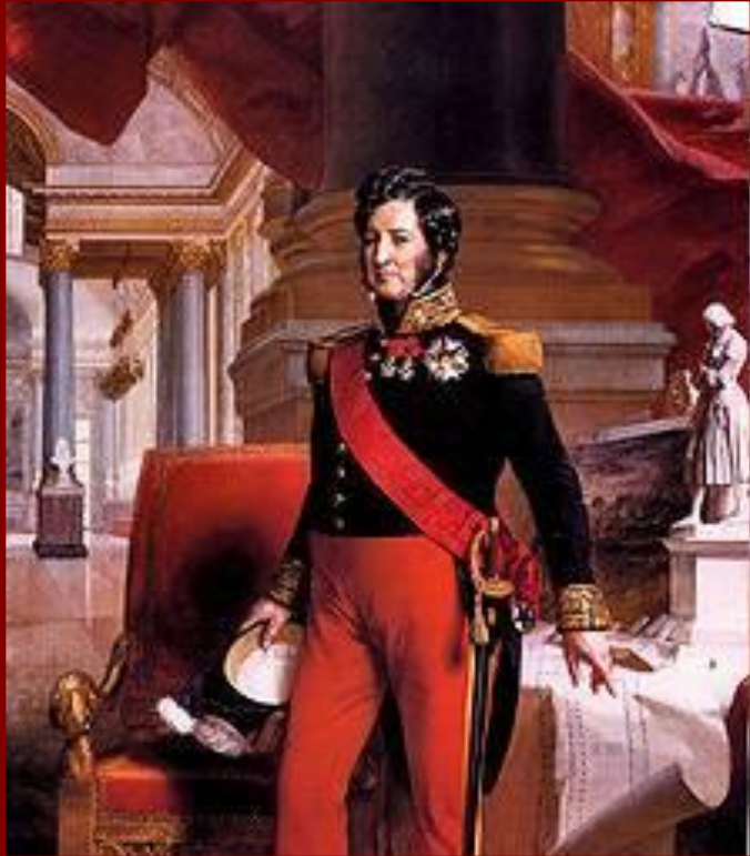
Луи-Филипп Орлеанский, последний французский король

27 июля на улицах Парижа вспыхнули баррикадные бои, зачинщиками которых были студенты.