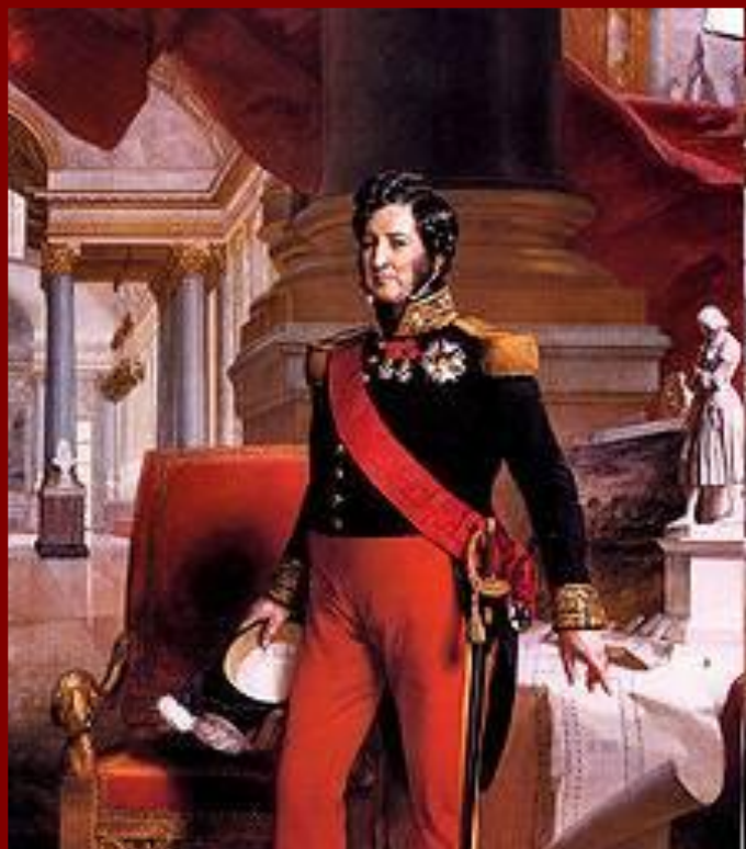
Луи-Филипп Орлеанский, последний французский король

27 июля на улицах Парижа вспыхнули баррикадные бои, зачинщиками которых были студенты.