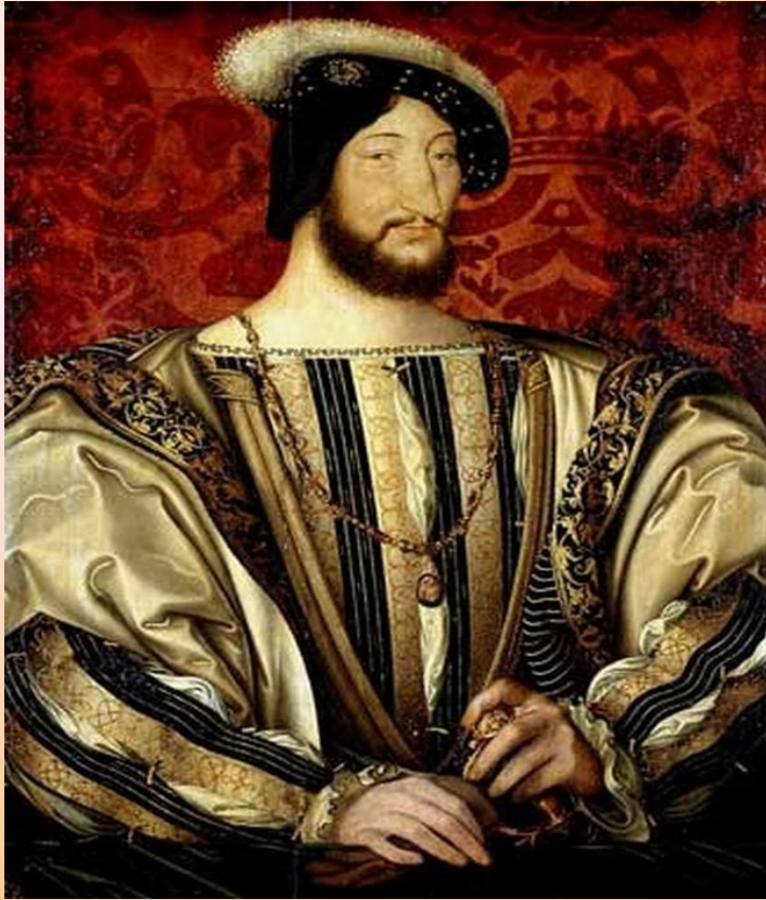
Франциск I Валуа