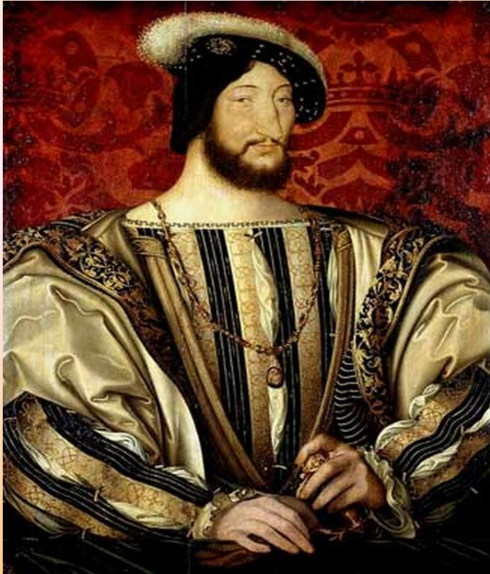
Франциск I Валуа