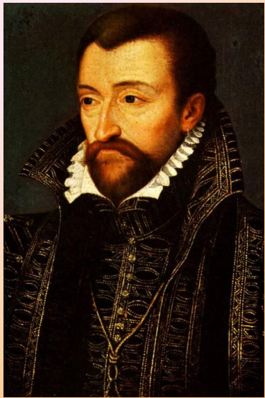
Генрих де Бурбон (Наваррский)