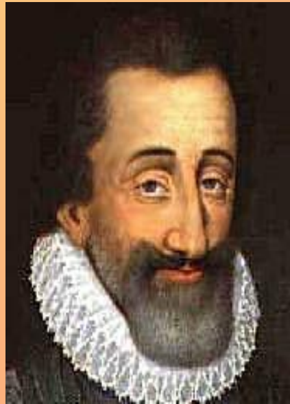
Король Наварры Антуан де Бурбон