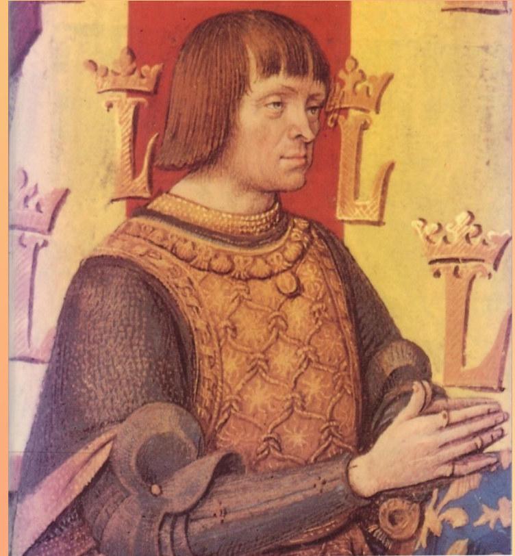
Генрих II Валуа