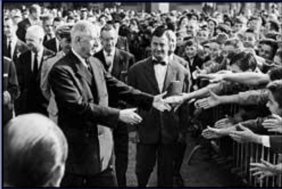
Французы приветствуют Шарля де Голля

В послевоенной Франции расставились политические силы, определявшие Французская Коммунистическая партия (ФКП), Социалистическая партия (СФИО), Католическая партия и Народно-республиканское движение (МРП). В октябре 1945 г. состоялись выборы в Учредительное собрание, победу на которых одержали левые силы, которые активно участвовали в Движении Сопротивления. Во главе сформировавшегося правительства стал Шарль де Голль. В 1946 г. была принята новая Конституция, которая знаменовала собой установление во Франции Четвёртой республики.