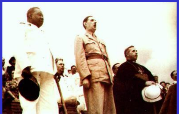
Генерал де Голль

Основные силы страны видели в Шарле де Голле сильную личность. В 1958 г. де Голль стал премьером и провел через референдум Конституцию, превращавшую Францию в президентскую республику. Последующий период вошёл в историю Франции под названием Пятой республики.