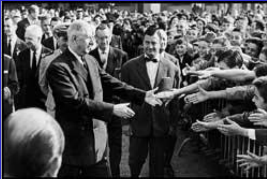
Французы приветствуют Шарля де Голля

на которых одержали левые силы, которые активно участвовали в Движении Сопротивления. Во главе сформировавшегося правительства стал Шарль де Голль. В 1946 г. была принята новая Конституция, которая знаменовала собой установление во Франции Четвёртой республики.