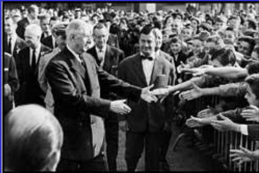
Французы приветствуют Шарля де Голля

вала собой установление во Франции Четвёртой республики.