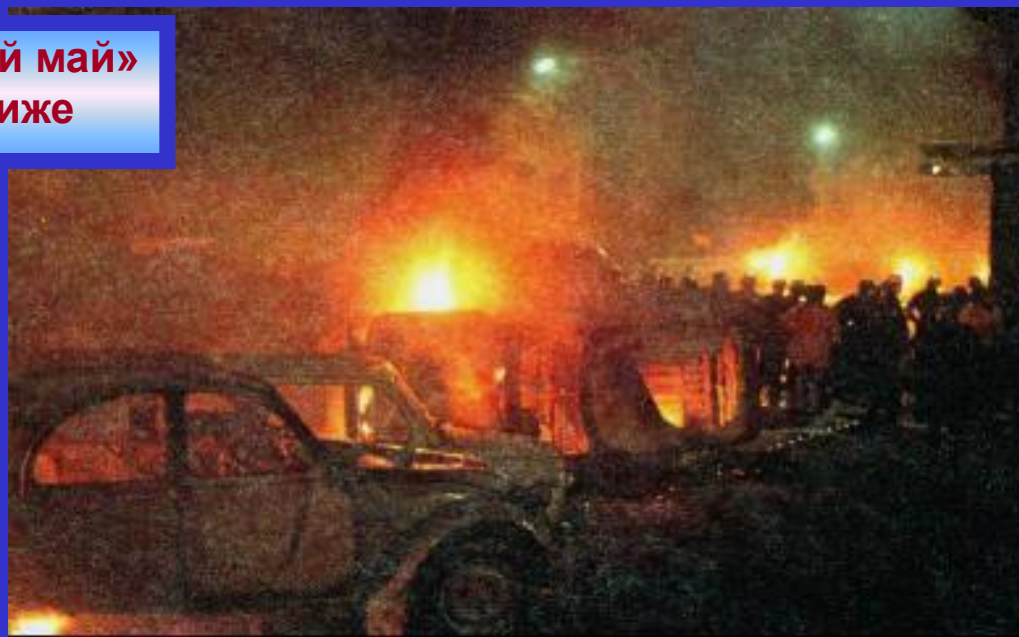
«Красный май» в Париже

Мощные выступления студентов прошли по всей Франции. Безработица среди молодёжи, авторитарные порядки в студенческих городках привели к социальному взрыву. В начале мая 1968 г. была разогнана студенческая демонстрация. В ответ студенты заняли Латинский квартал Парижа. Их лидер, Кон-Бендит призвал к решительной борьбе с капиталистической системой.