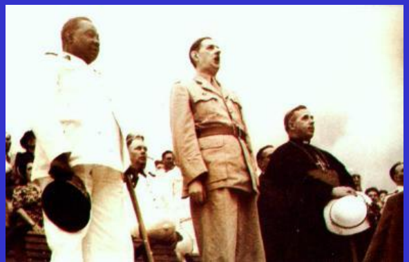
Генерал де Голль

Основные силы страны видели в Шарле де Голле сильную личность. В 1958 г. де Голль стал премьером и провел через референдум Конституцию, превращавшую Францию в президентскую республику. Последующий период вошёл в историю Франции под названием Пятой республики.