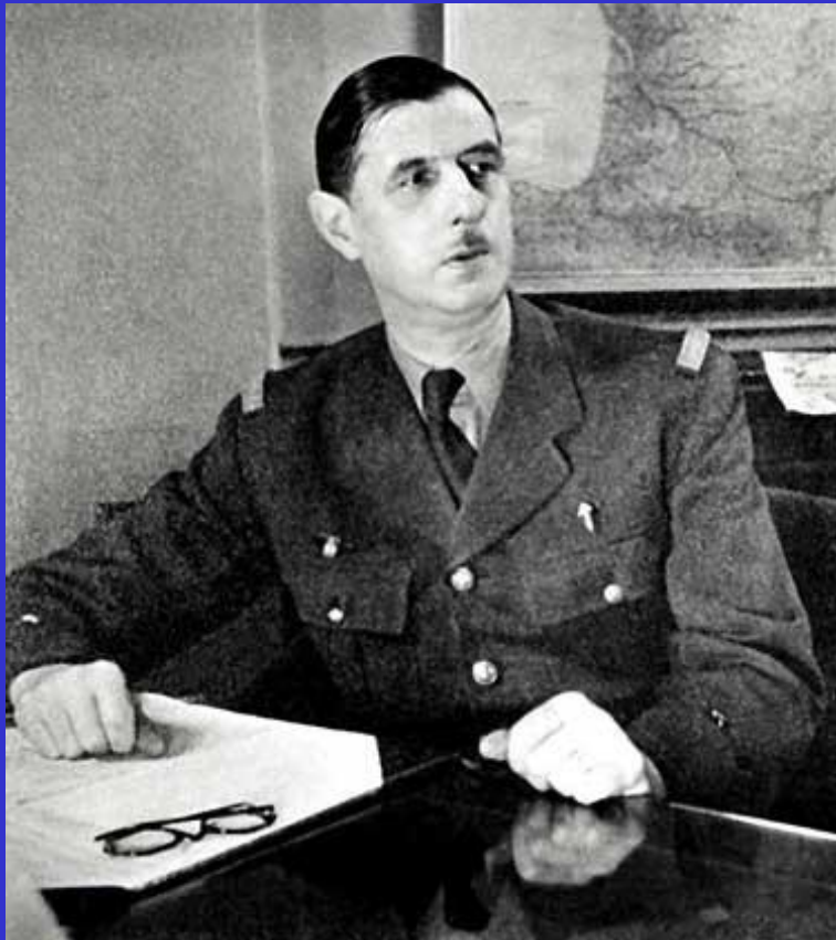
Шарль де Голль

После окончания Второй мировой войны Франция утратила положение великой державы. На фоне экономического упадка страна попала в зависимость от финансовой политики США. После войны распалась и французская колониальная система. Летом 1944 г. во Франции было образовано Временное правительство, которое возглавил Шарль де Голль. Оно начало подготовку к выборам Учредительного собрания. В стране был восстановлен демократический строй. К суду были привлечены люди, сотрудничавшие с гитлеровцами. В экономике страны были национализированы ряд отраслей промышленности.