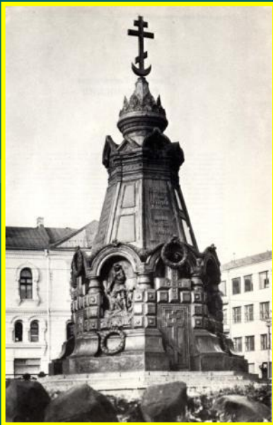
Часовня павшим в боях за Плевну (архитектор В.О. Шервуд), г.Москва