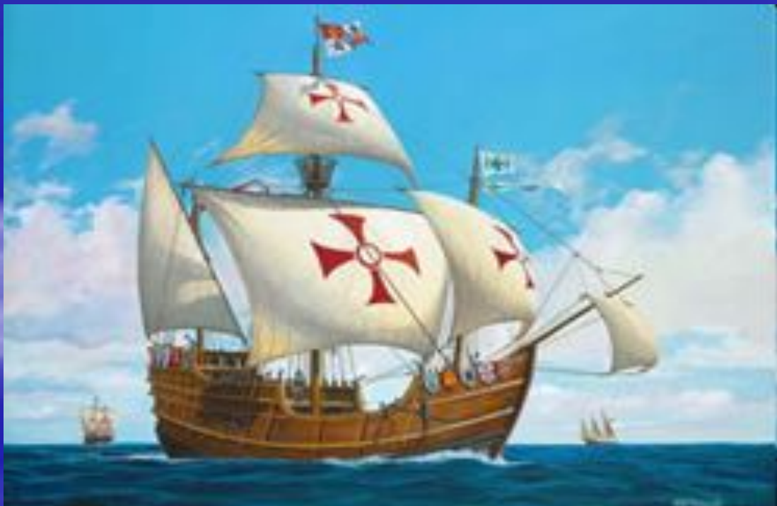
«Санта-Мария» Флагманский корабль, на котором находился Христофор Колумб