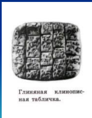
Глиняная клинопис- ная табличка.