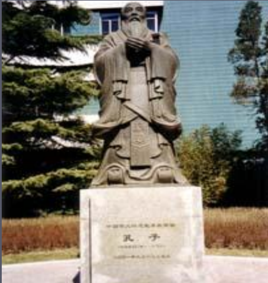
Памятник Конфуцию. Пекинский университет.