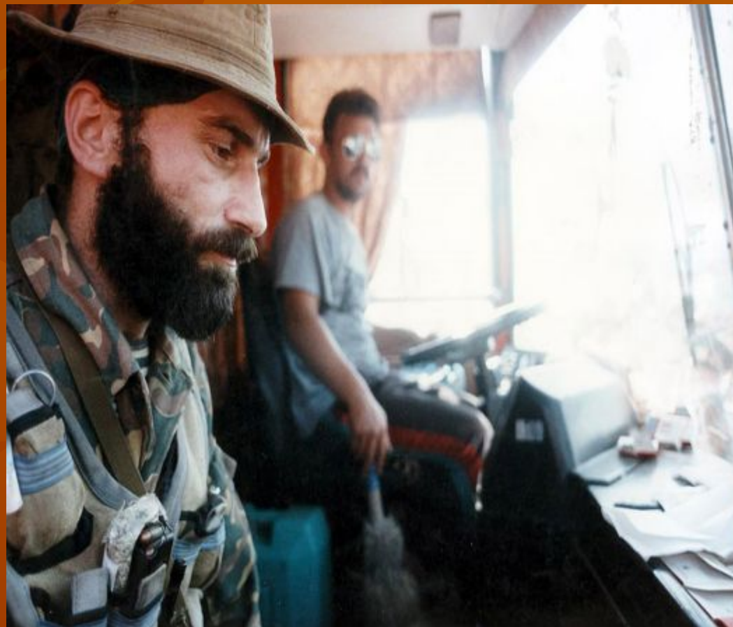
Шамиль Басаев Шамиль Басаев в автобусе с заложниками

Общие потери российской стороны, по официальным данным, составили 143 человека (из которых 46 являлись сотрудниками силовых структур) и 415 раненных, потери террористов — 19 убитыми и 20 ранеными.