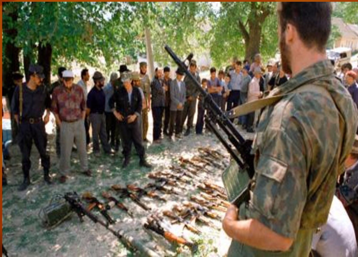
Задержание Участников банд группы Бараева

■ Боевики, напротив, сделали ставку на интернационализацию конфликта, вовлекая в свою борьбу вооруженные отряды нечеченского происхождения. К началу 2005, после уничтожения Масхадова, Хаттаба, Бараева, Абу аль-Валида и многих других полевых командиров, интенсивность диверсионно-террористической деятельности боевиков значительно снизилась.