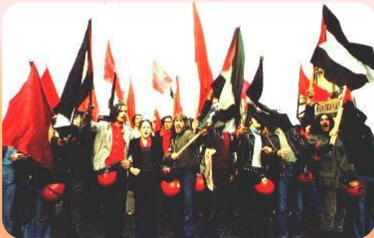
Антиправительственная демонстрация в Париже

Тогда профсоюзы и правительство подписали соглашение, улучшавшее экономическое положение рабочих. В нём ничего не говорилось о социальных реформах и рабочие продолжили забастовку. Де Голль договорился с французскими генералами о поддержке. Он объявил о коммунистической угрозе и распустил парламент. Оппозиция опасаясь гражданской войны решила прекратить выступления. В 1969 г. по был проведён референдум, на который был вынесен вопрос о реформе системы самоуправления в стране. Более половины участников референдума не поддержали де Голля и он ушёл в отставку.