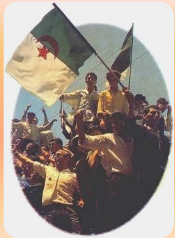
Провозглашение независимости Алжира