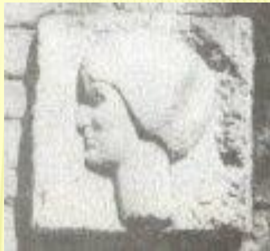
Гипсовый силуэт на могиле