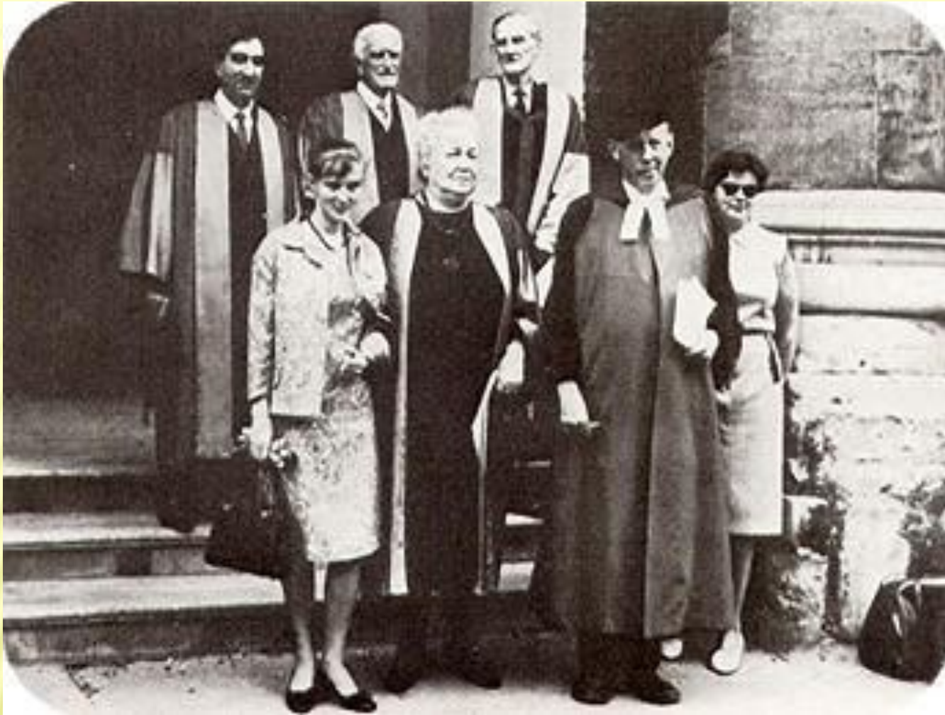
Анна Ахматова после торжественной церемонии присуждения звания доктора литературы.