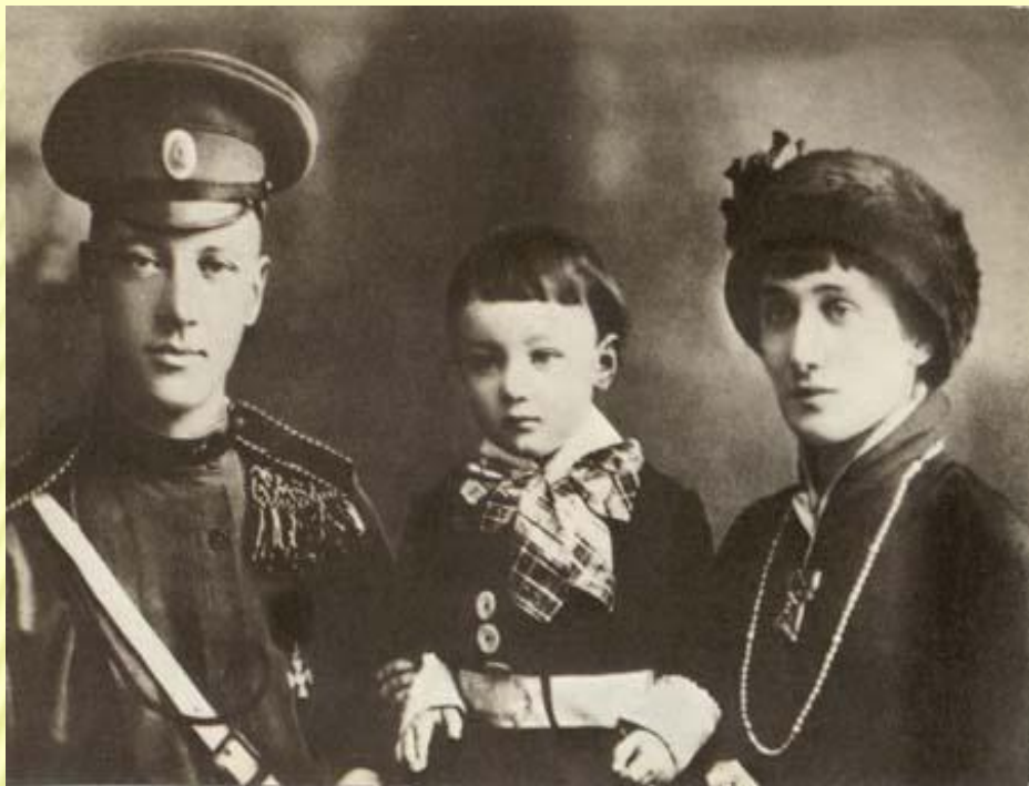
А.Ахматова, Н.Гумилев с сыном. 1916 год