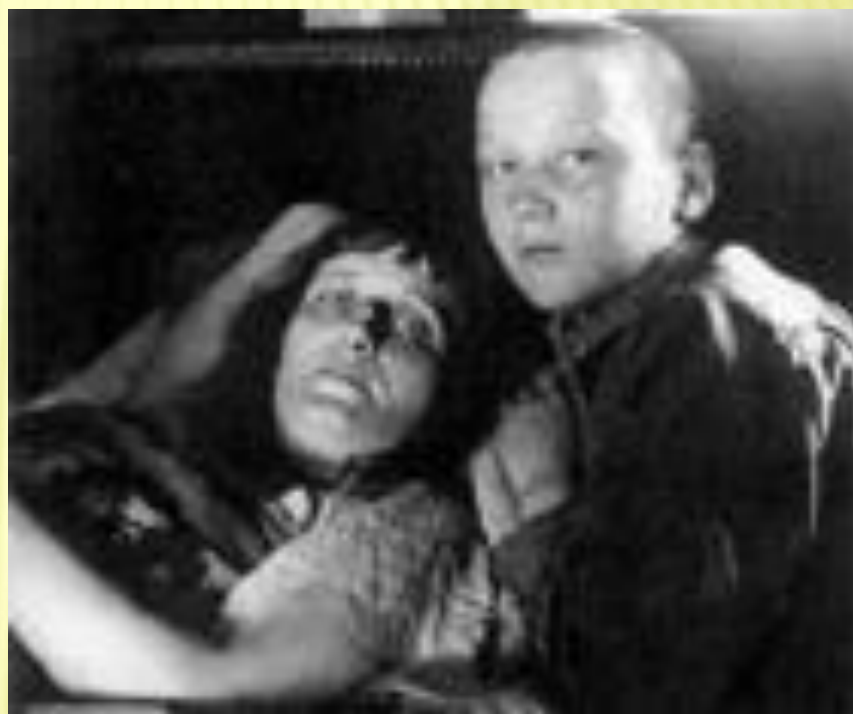
А.Ахматова с сыном.