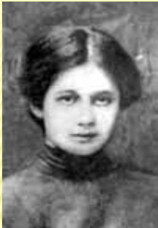
А.Ахматова в гимназии