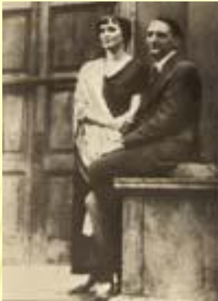
А.Ахматова и Н.Пунин. 1927 год