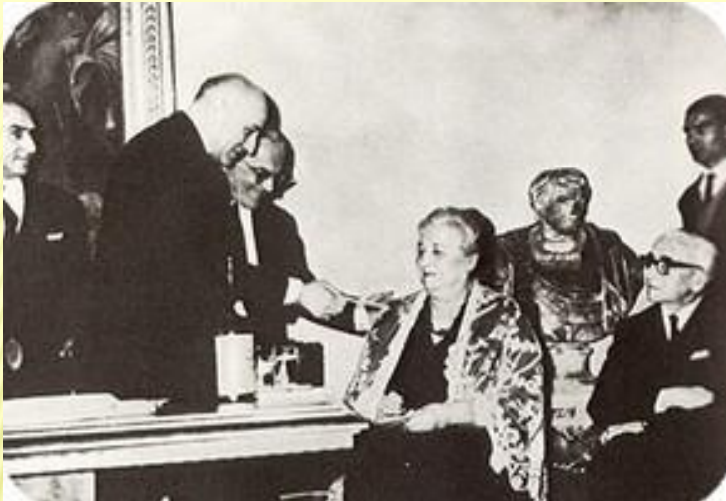
Вручение Анне Ахматовой международной премии «Этна Таормина». Италия. 1964 год.