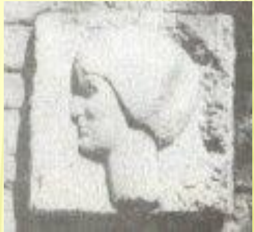
Гипсовый силуэт на могиле