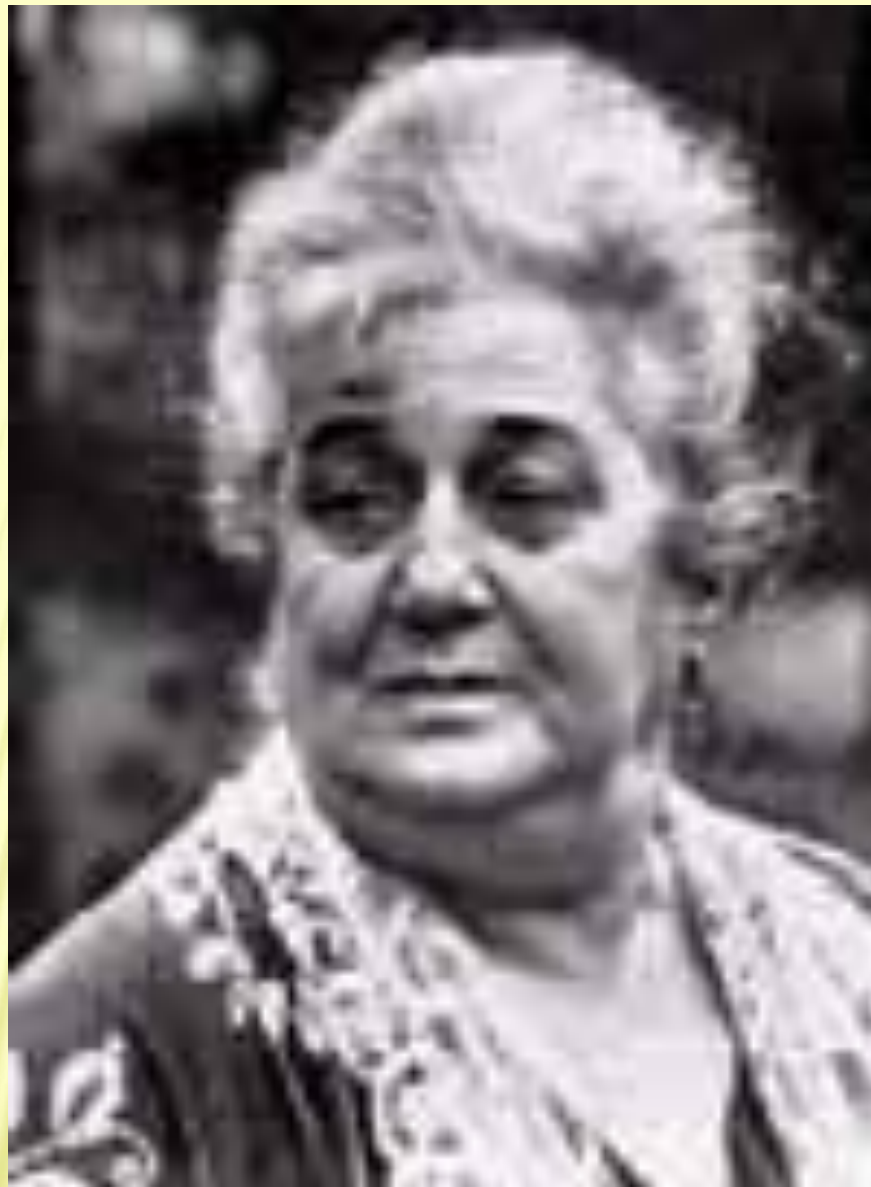
А.Ахматова. 1966 год