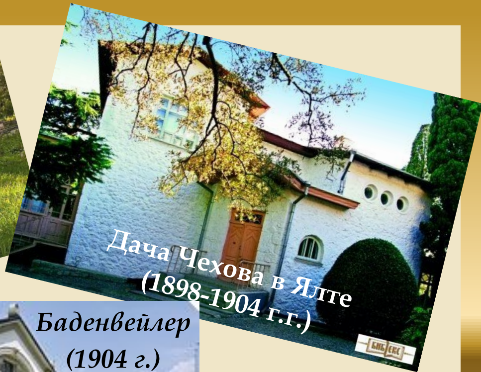
Дача Чехова в Ялте (1898-1904 г.г.)