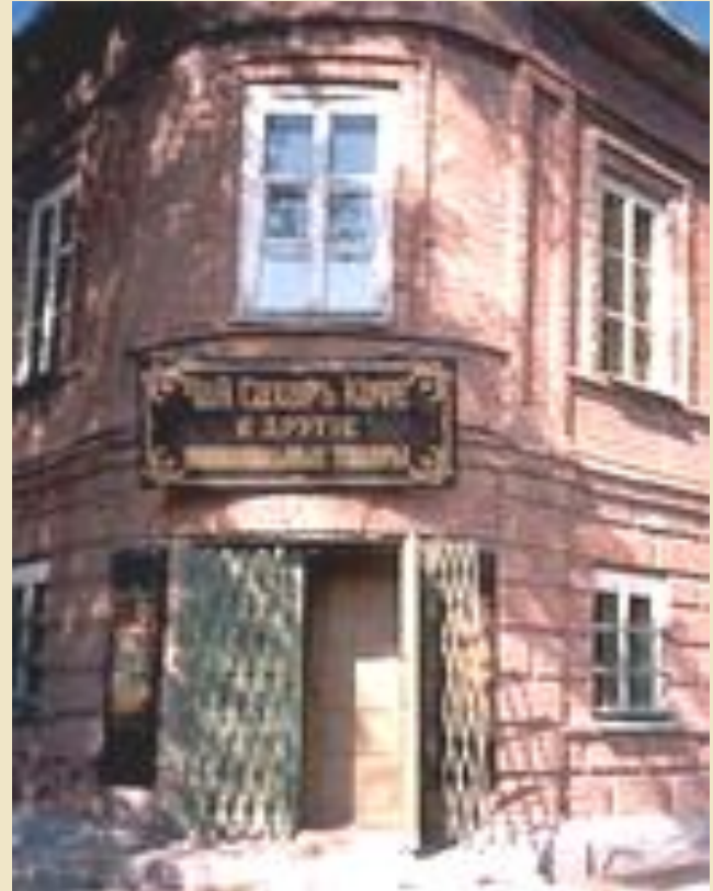
Лавка отца Чехова «Чай, сахар, кофе и другие колониальные товары»

В детстве Антон с раннего утра до позднего вечера работал в лавке.