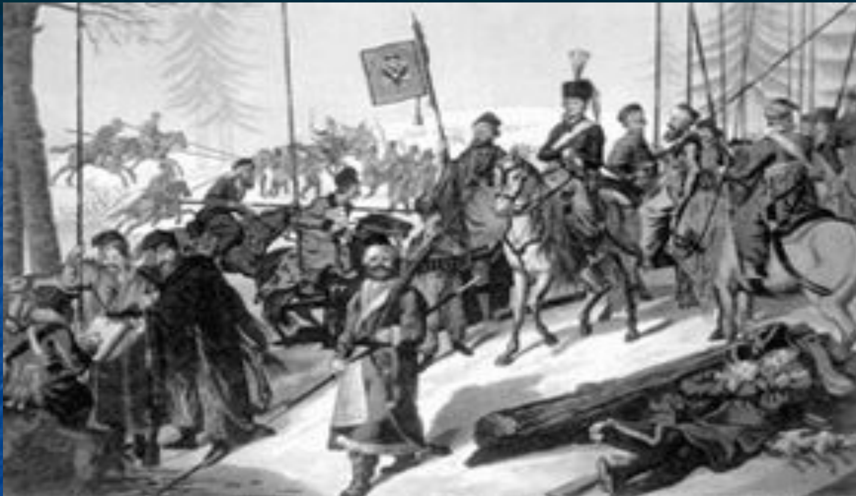
Партизаны в походе