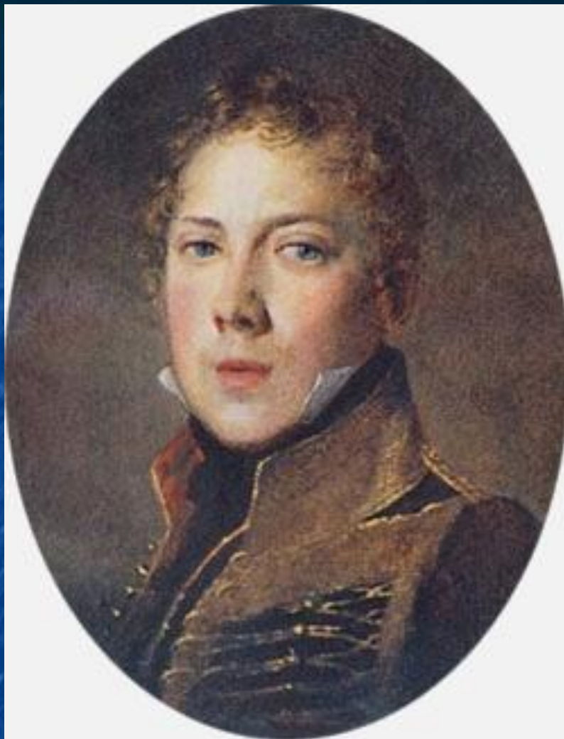
Петр Яковлевич Чаадаев