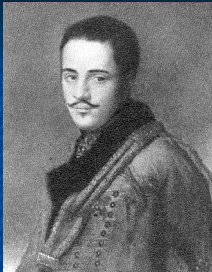
Александр и Николай Раевские