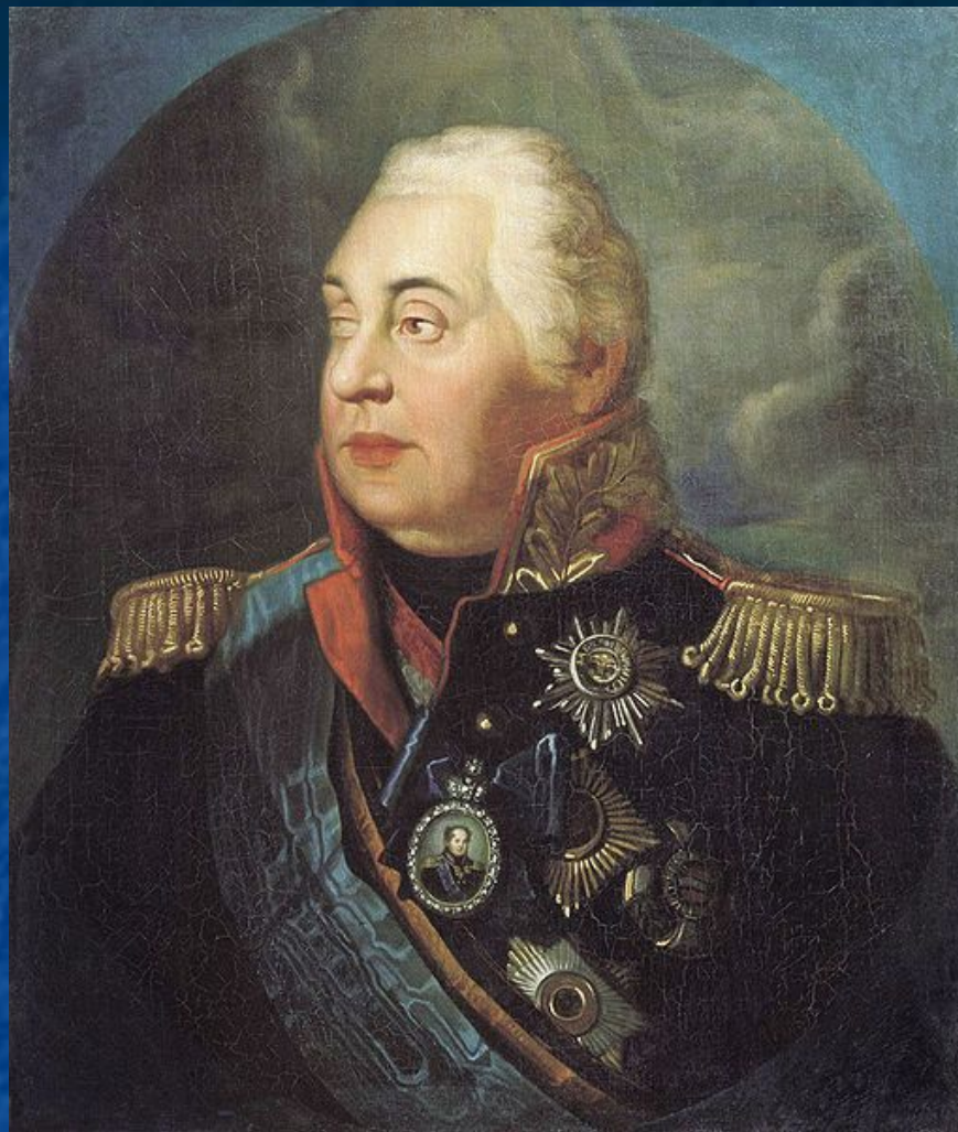
Кутузов Михаил Илларионович