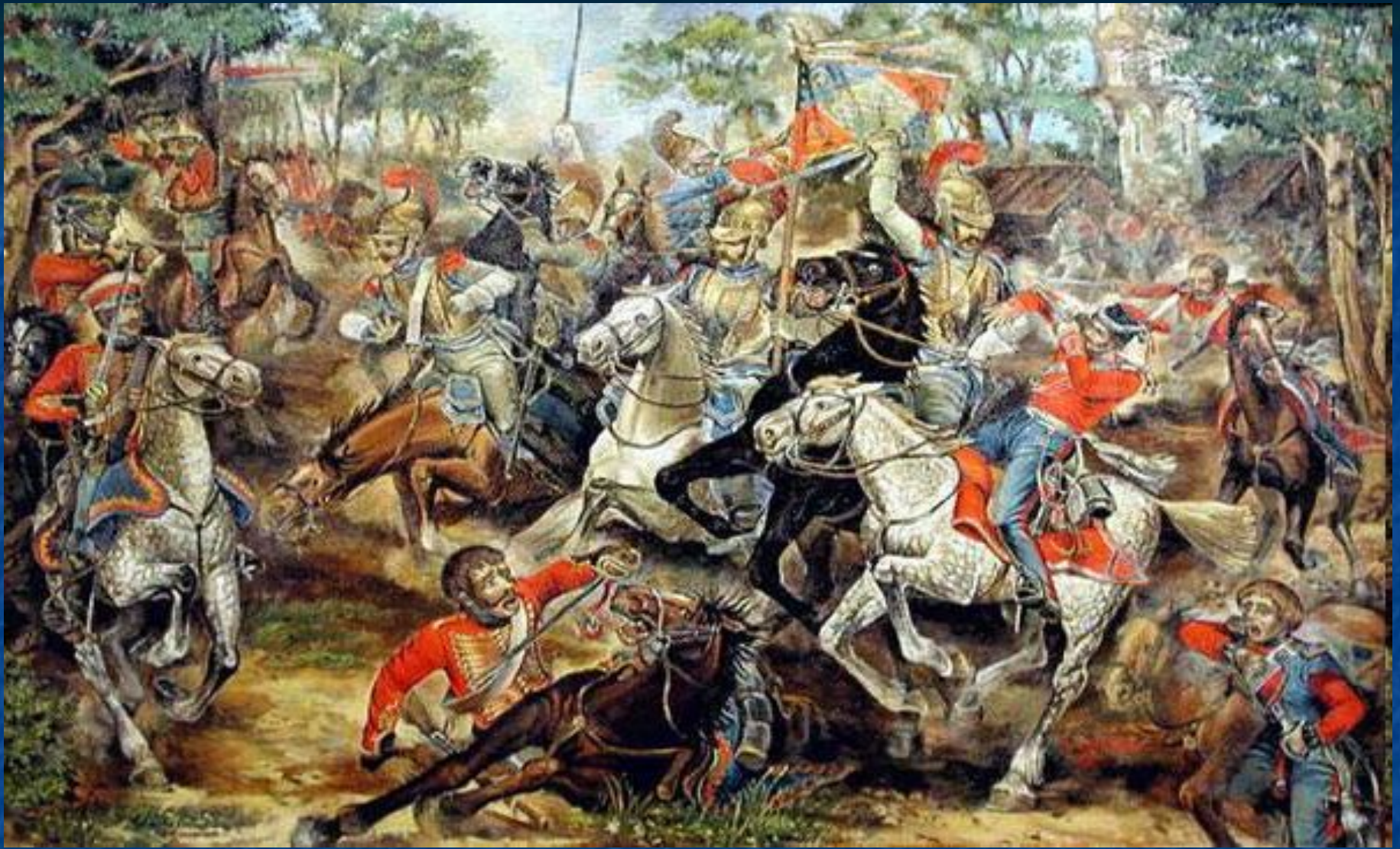
Русская армия. 1812г.