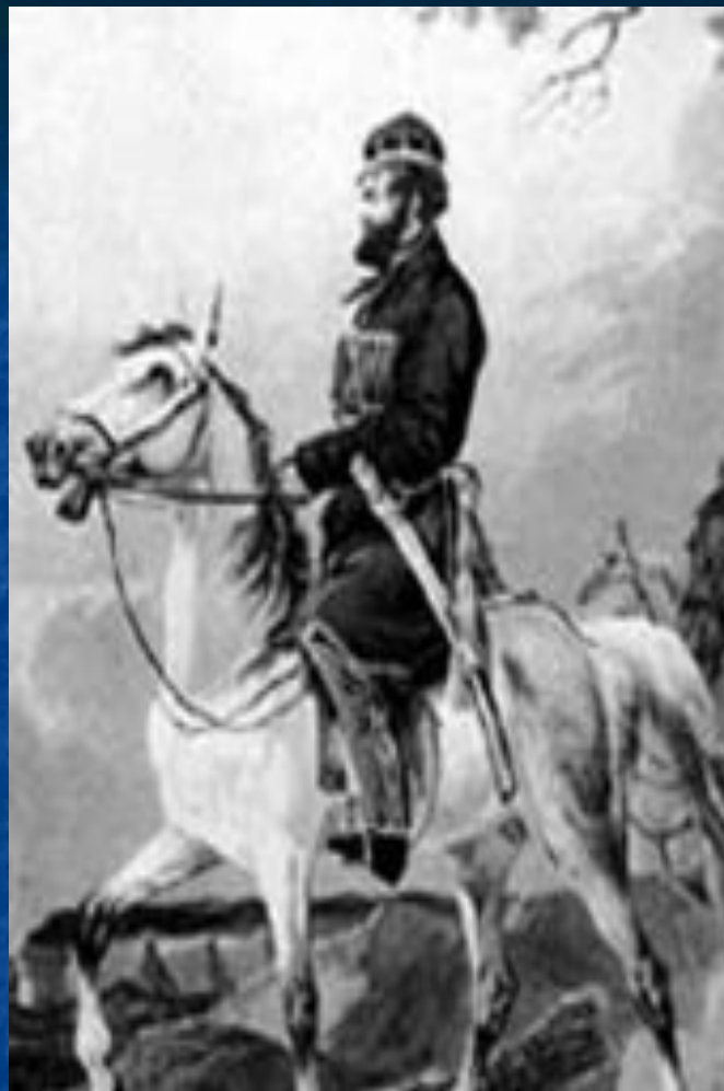
Денис Давыдов – храбрец, гусар, поэт.