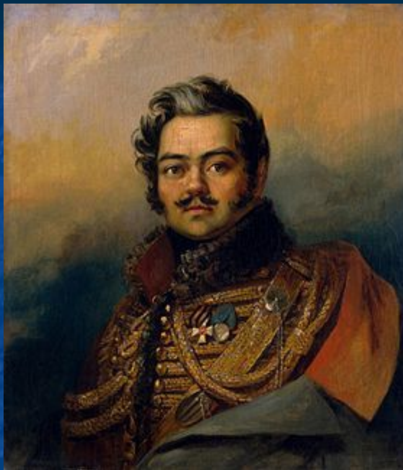
Денис Давыдов – храбрец, гусар, поэт.