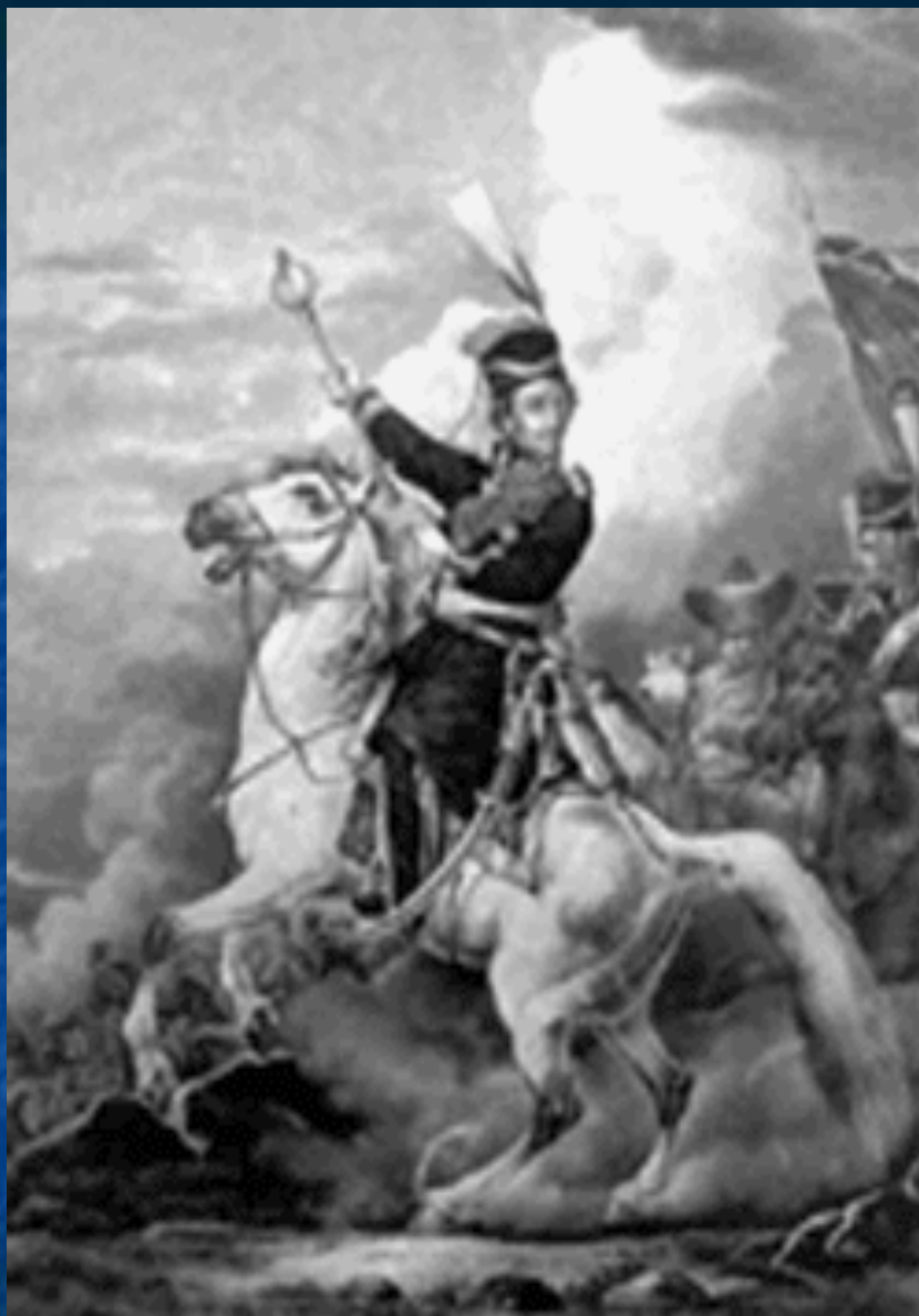
Платов Матвей Иванович