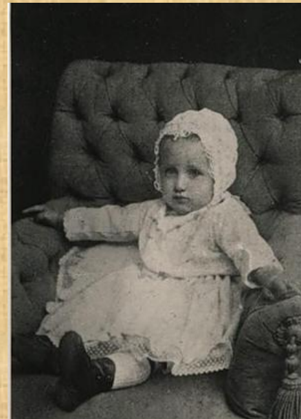
А. Ахматова в детстве