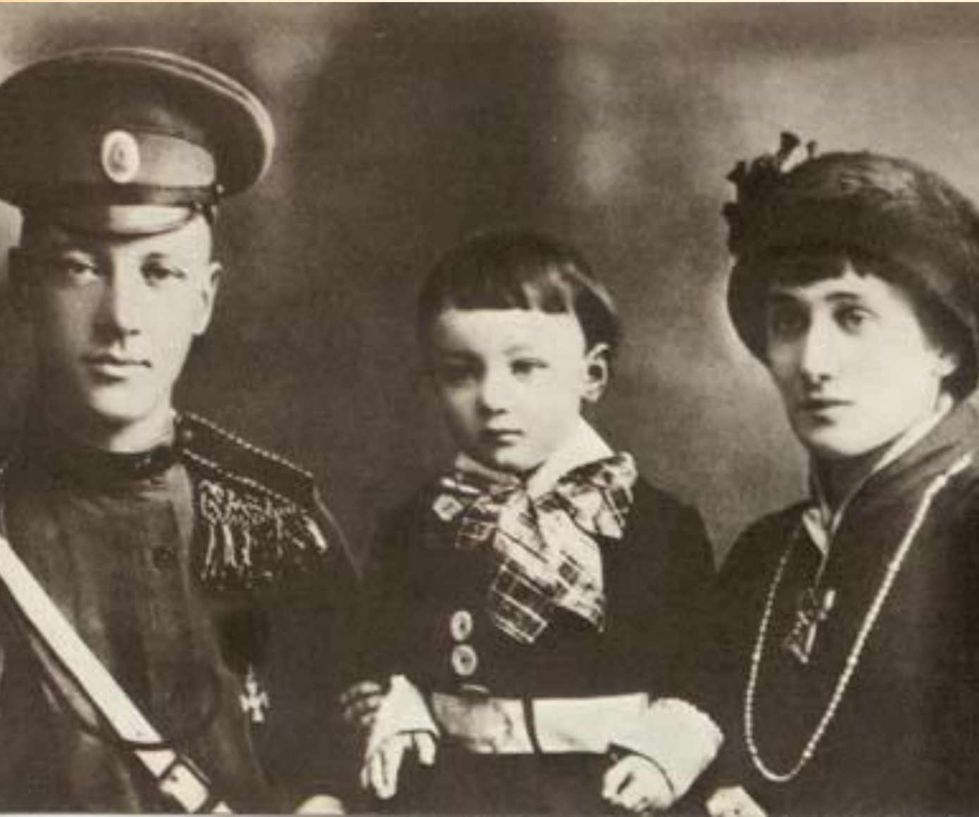
Николай Гумилев и Анна Ахматова с сыном Левой. 1915 год