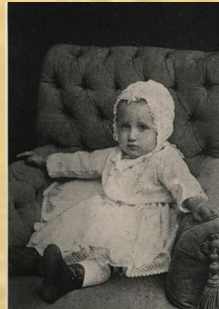
А. Ахматова в детстве