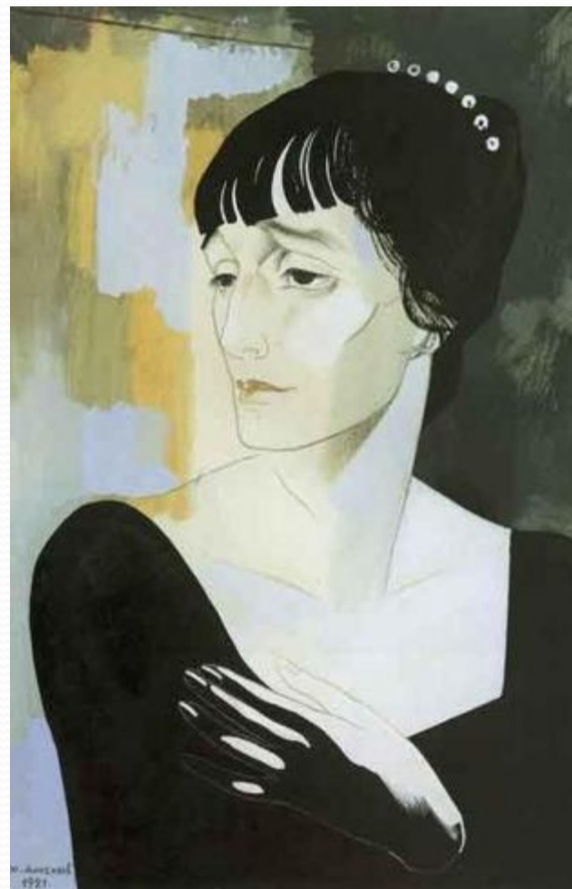
Ю. Анненков 1921