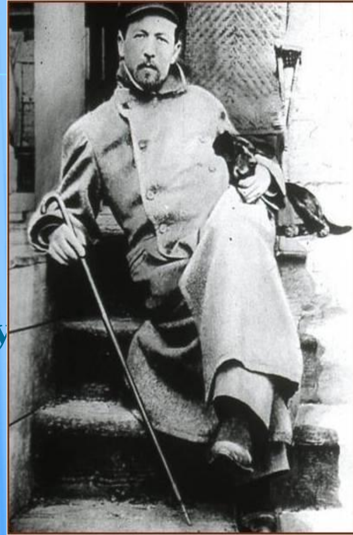
А.П. Чехов по возвращении из клиники

□ Весной 1897 года у Чехова началось резкое обострение туберкулезного процесса, давно беспокоящего его здоровье. В больнице Чехова посетил Л.Н. Толстой: «В клинике был у меня Лев Николаевич, с которым вели мы преинтересный разговор... Говорили о бессмертии». После чего Антон Павлович умирает.