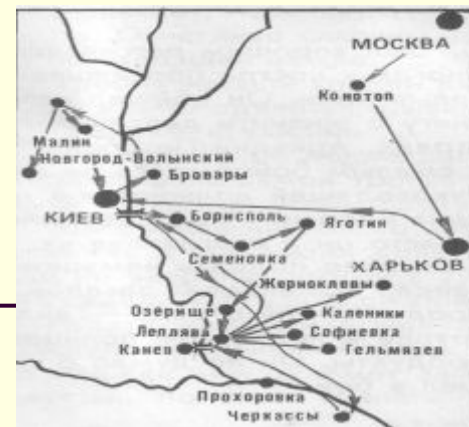
Карта боевых дорог А.Гайдара.