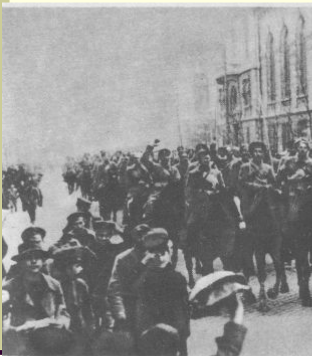
На улицах города.