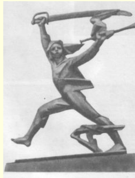
Скульптура Мальчиша-Кибальчиша в Москве на Ленинских горах.