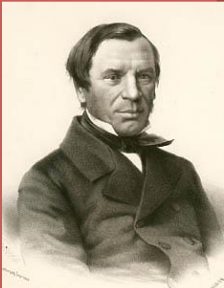
М. П. Погодин

До 14 лет Фет жил и учился дома, а затем в городе Верро (Лифляндский губернии), в пансионе Кроммера. В 1837 г. его перевезли в Москву и поместили у М. П. Погодина; вскоре за тем Афанасий Афанасьевич поступил в Московский университет, на историко-филологический факультет. Почти все студенческое время Фет прожил в семье своего товарища по университету, будущего литературного критика Аполлона Григорьева, имевшего влияние на