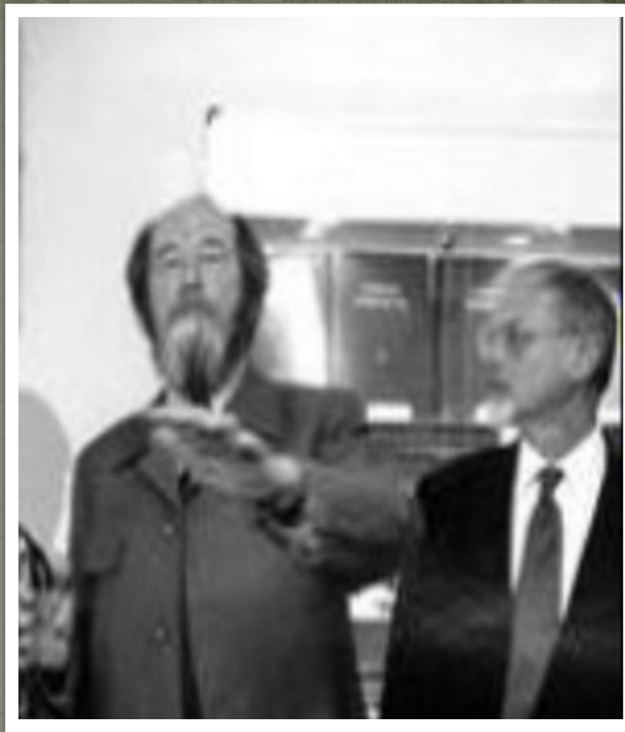
Н.Струве и А. Солженицын

– Как об этом можно сказать одним словом? Вера в его жизни играла очень большую роль – об этом Александр Исаевич писал в "Архипелаге ГУЛАГ", он верил в Провидение, в сверхмирность. В своем американском доме он основал домашнюю церковь, и на освящении, когда мы с ним литургисали, так сказать, служил отец Александр Шмеман. Я помню, тогда Александр Исаевич сказал: "Когда служит отец Александр – я все понимаю".