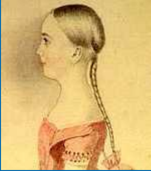
□ Старшая дочь, Мария Александровна Пушкина (1832-1919г.)