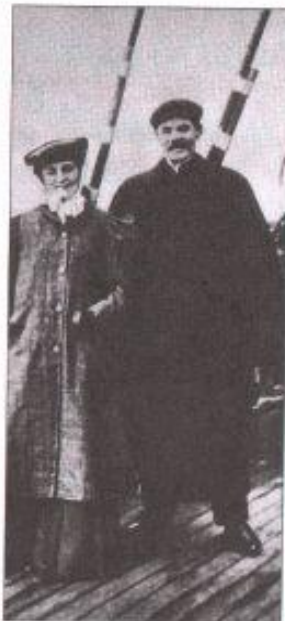
М. Горький и М. Андреева на пути в Америку. 1906

Статья «Буря энтузиазма...» о приезде Горького в США в газете «Нью-Йорк Таймс»