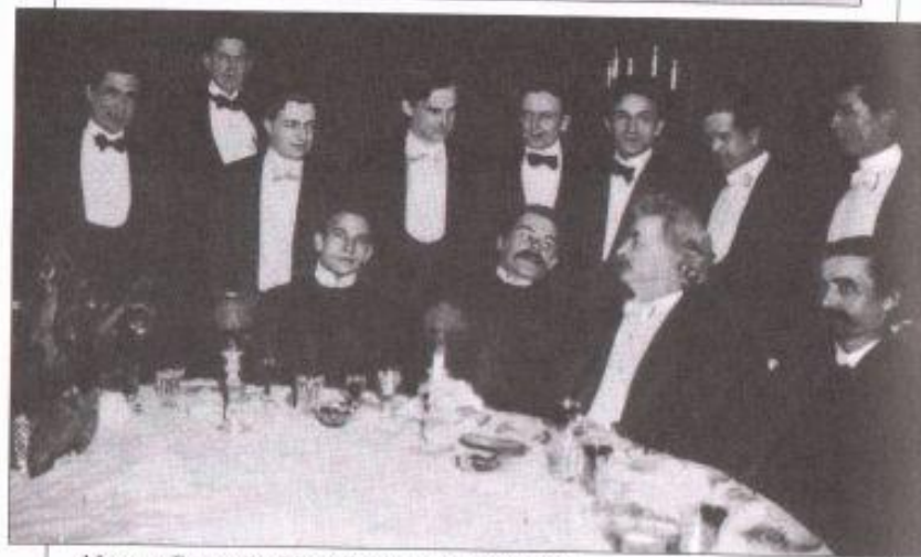
Максим Горький и Марк Твен в клубе писателей. Нью-Йорк, 1906