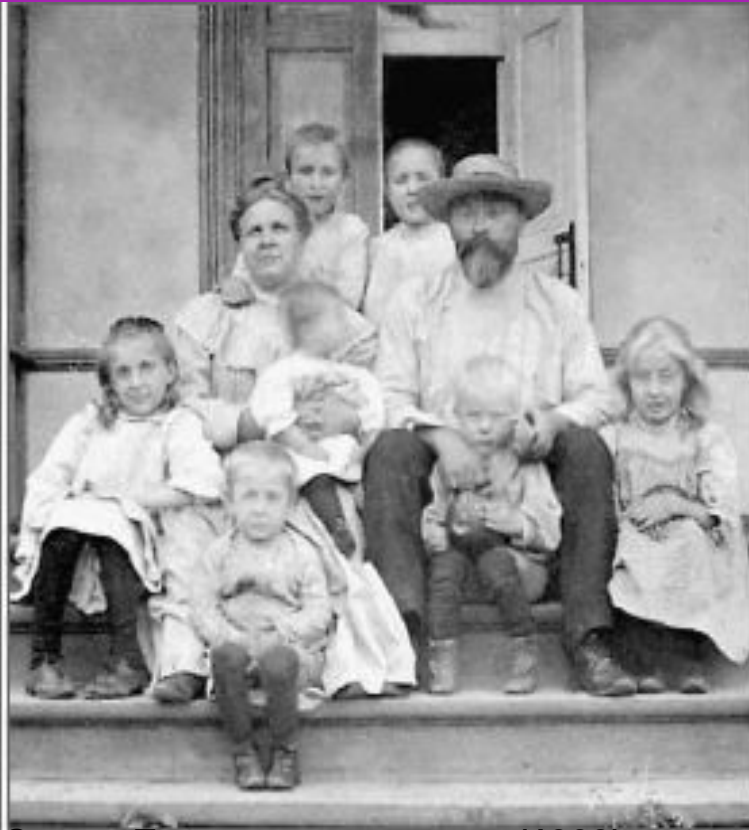
Семья Булгаковых на даче (1903)

В загородном доме– даче, в поселке Буча под Киевом, семья регулярно проводила летние месяцы