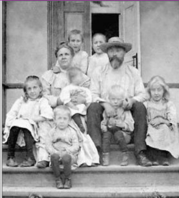
Семья Булгаковых на даче (1903)

В загородном доме– даче, в поселке Буча под Киевом, семья регулярно проводила летние месяцы