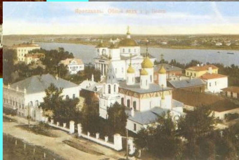
Ярославль. Общий вид и река Волга.