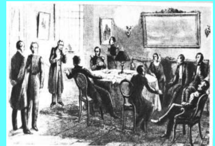
Редакция журнала «Современник»