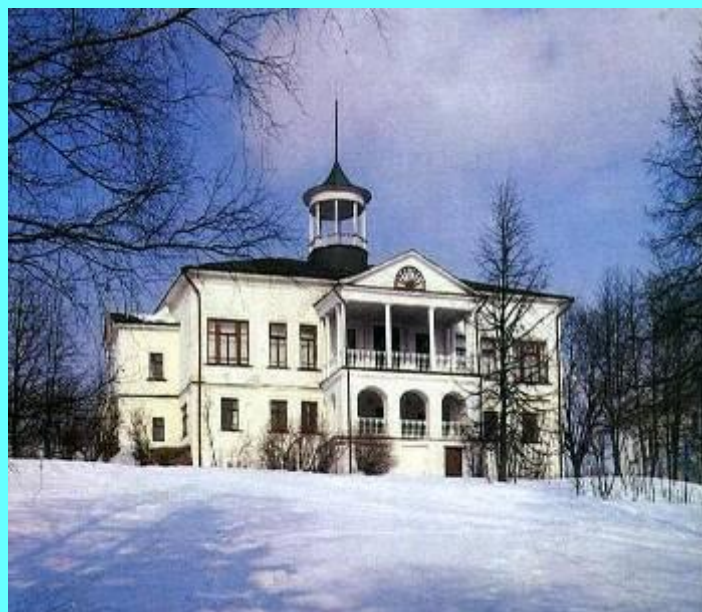
Дом-музей в Карабихе