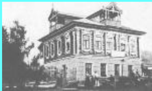
Дом-усадьба в Грешнёво