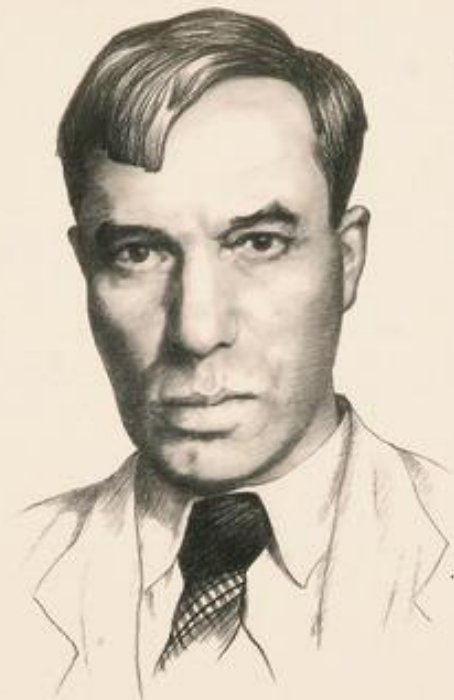
Борис Леонидович Пастернак 1890—1960