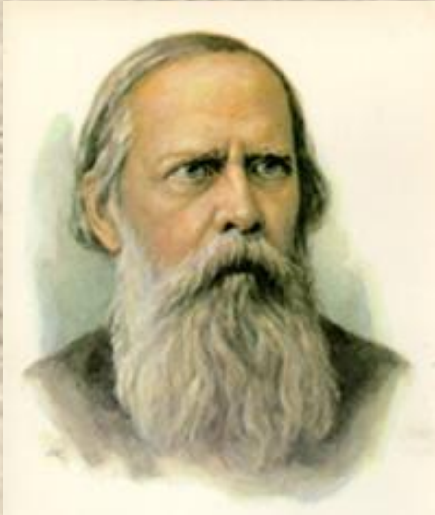
Салтыков-Щедрин (псевдоним - Н. Щедрин) Михаил Евграфович (1826 - 1889), прозаик.