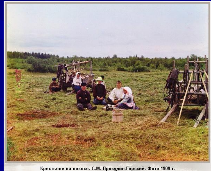
Крестьяне на покосе. С.М. Прокудин-Горский. Фото 1909 г.