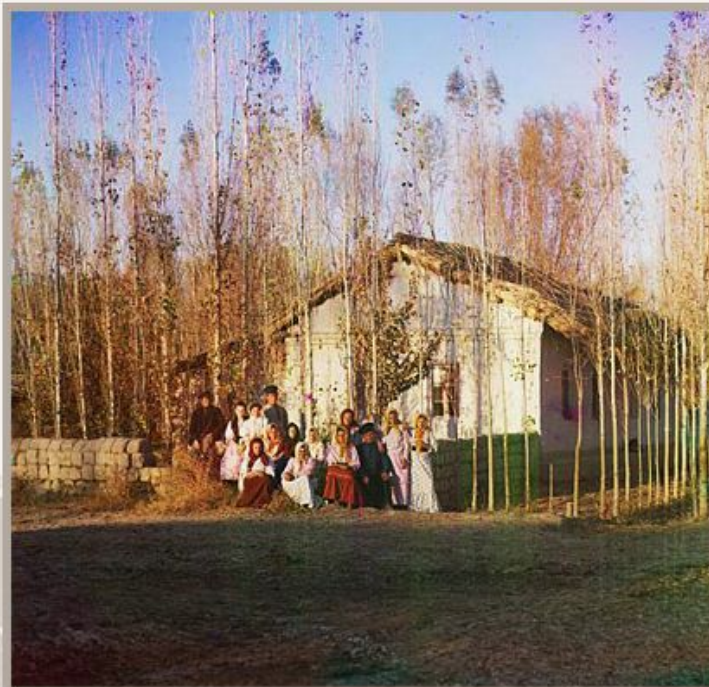
Крестьяне-переселенцы. С.М. Прокудин-Горский. Фото 1910-х гг.

Случаи обратного возвращения переселенцев из Сибири на родину, хотя и были, не в незначительном количестве».