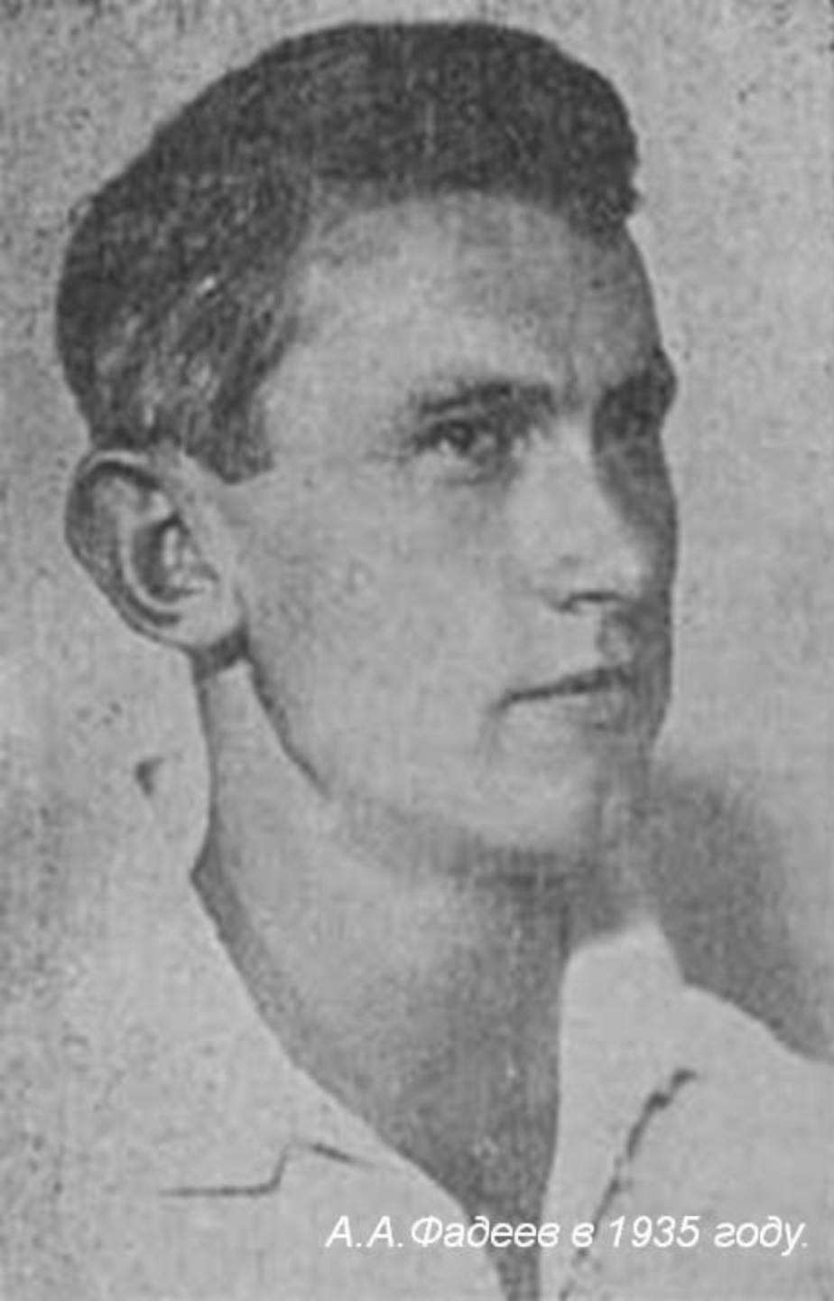
А.А. Фадеев в 1935 году.