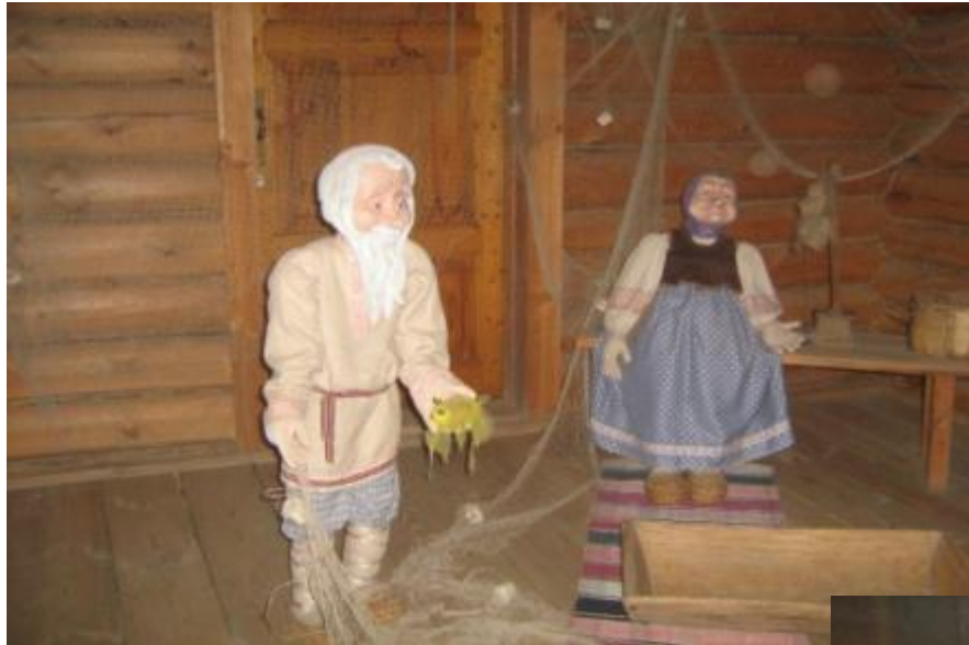
«О рыбаке и рыбке»