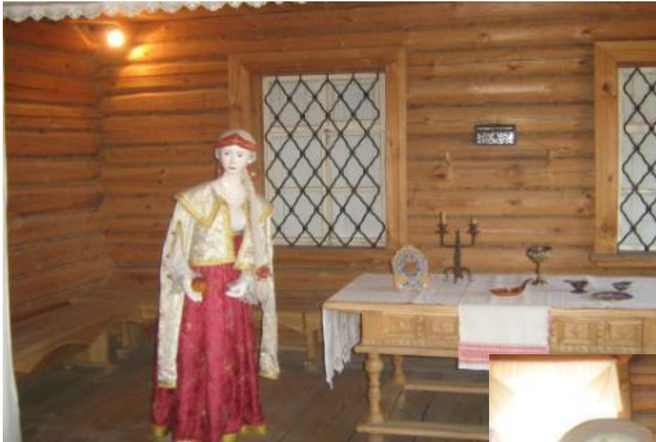
«Сказка о мертвой царевне»