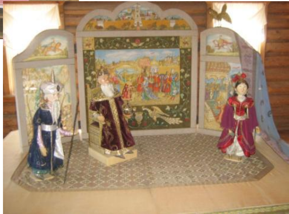
«Сказка о золотом петушке»