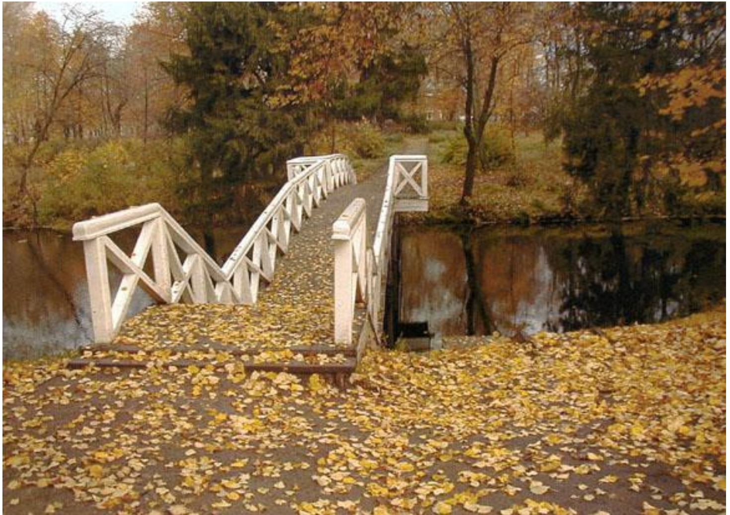
Горбатый мостик на Верхнем пруду