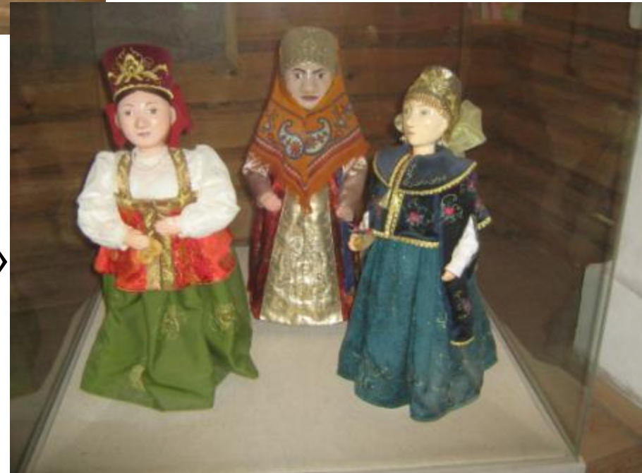
«Сказка о царе Салтане»