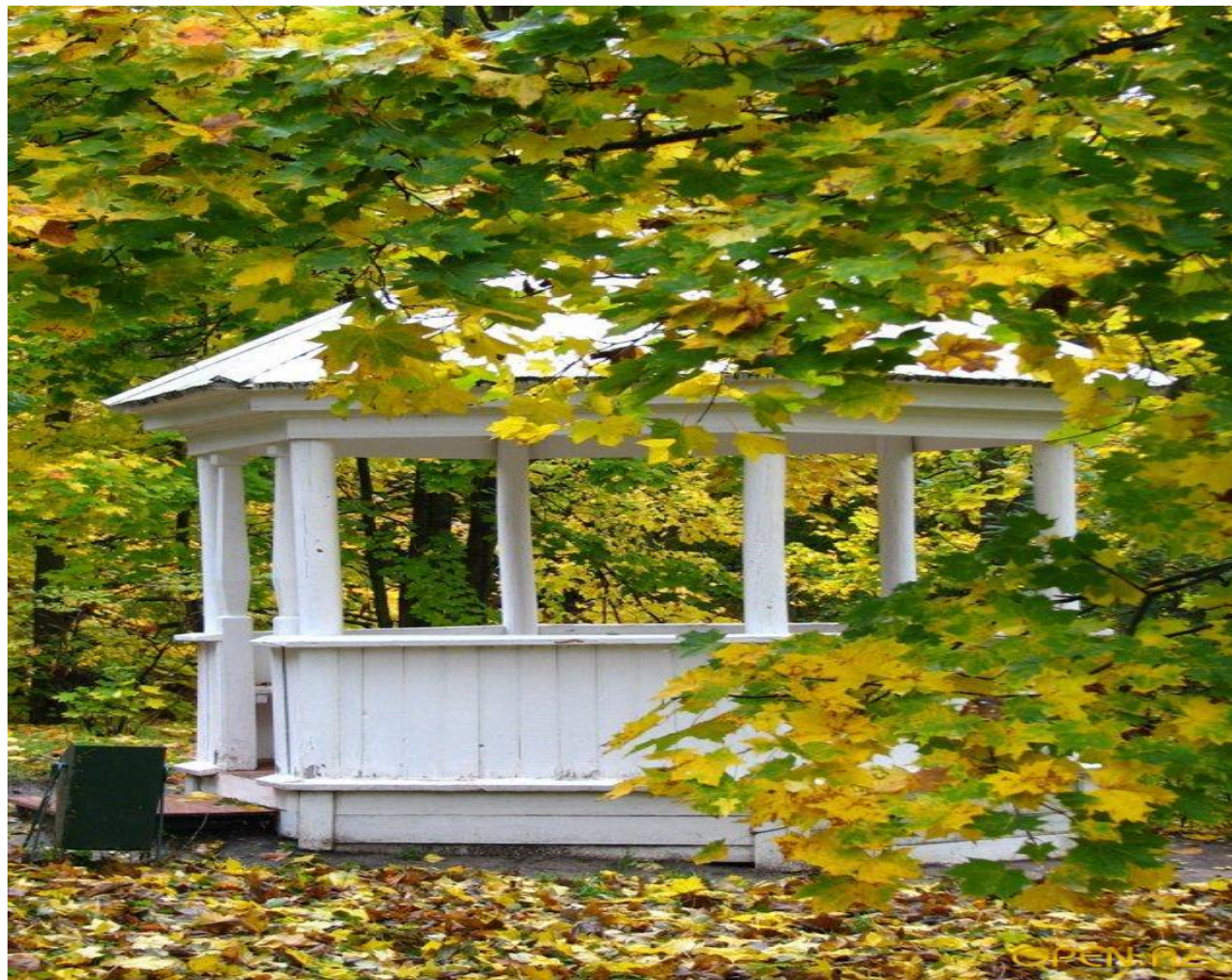
Беседка на берегу Нижнего пруда