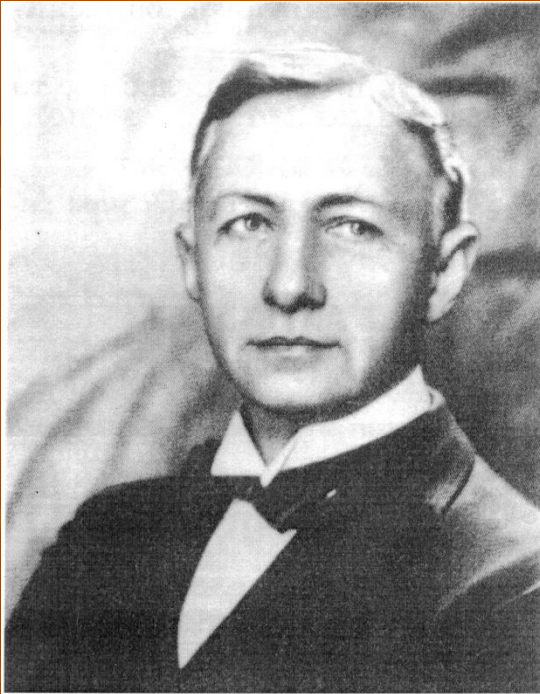
ИВАН АЛЕКСЕЕВИЧ БУНИН 1870 - 1953