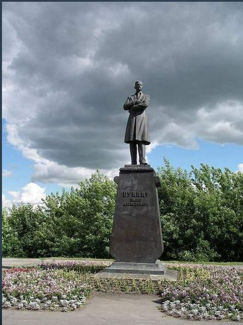
Памятник Ивану Бунину в г. Орле