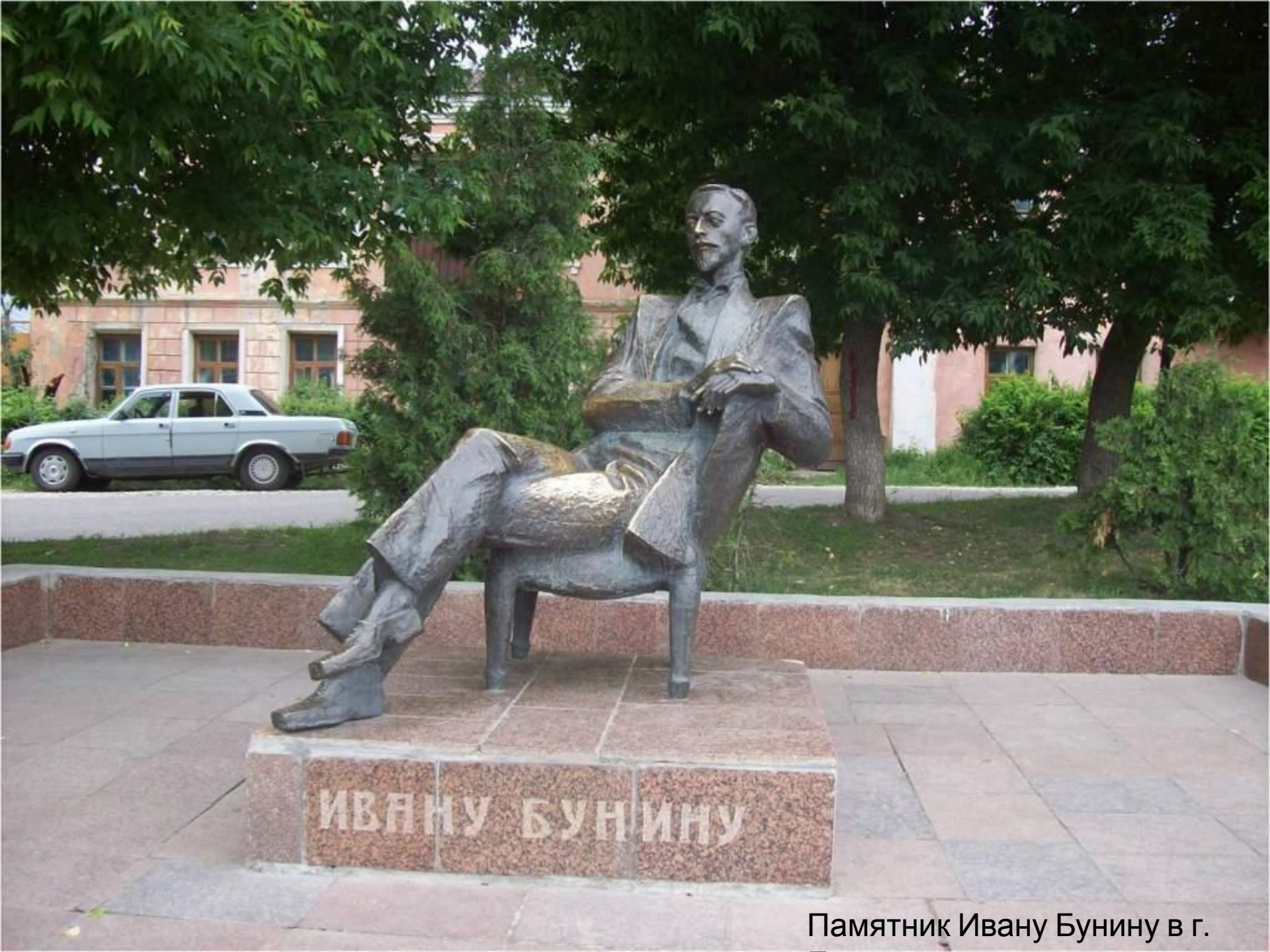
Памятник Ивану Бунину в г.