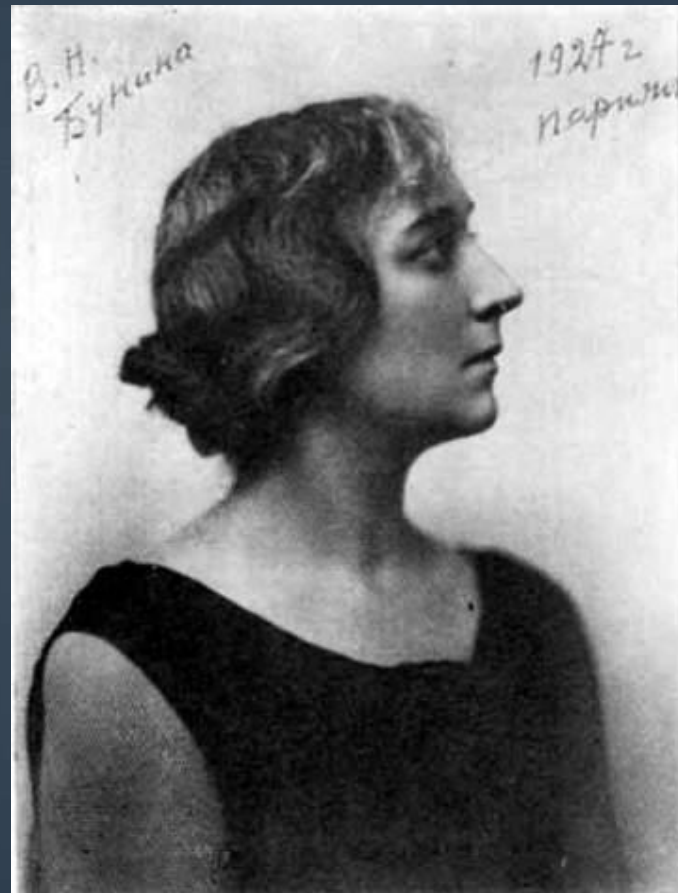
Дочь члена Московской городской управы и племянница председателя Первой Государственной Думы С.А. Муромцева.