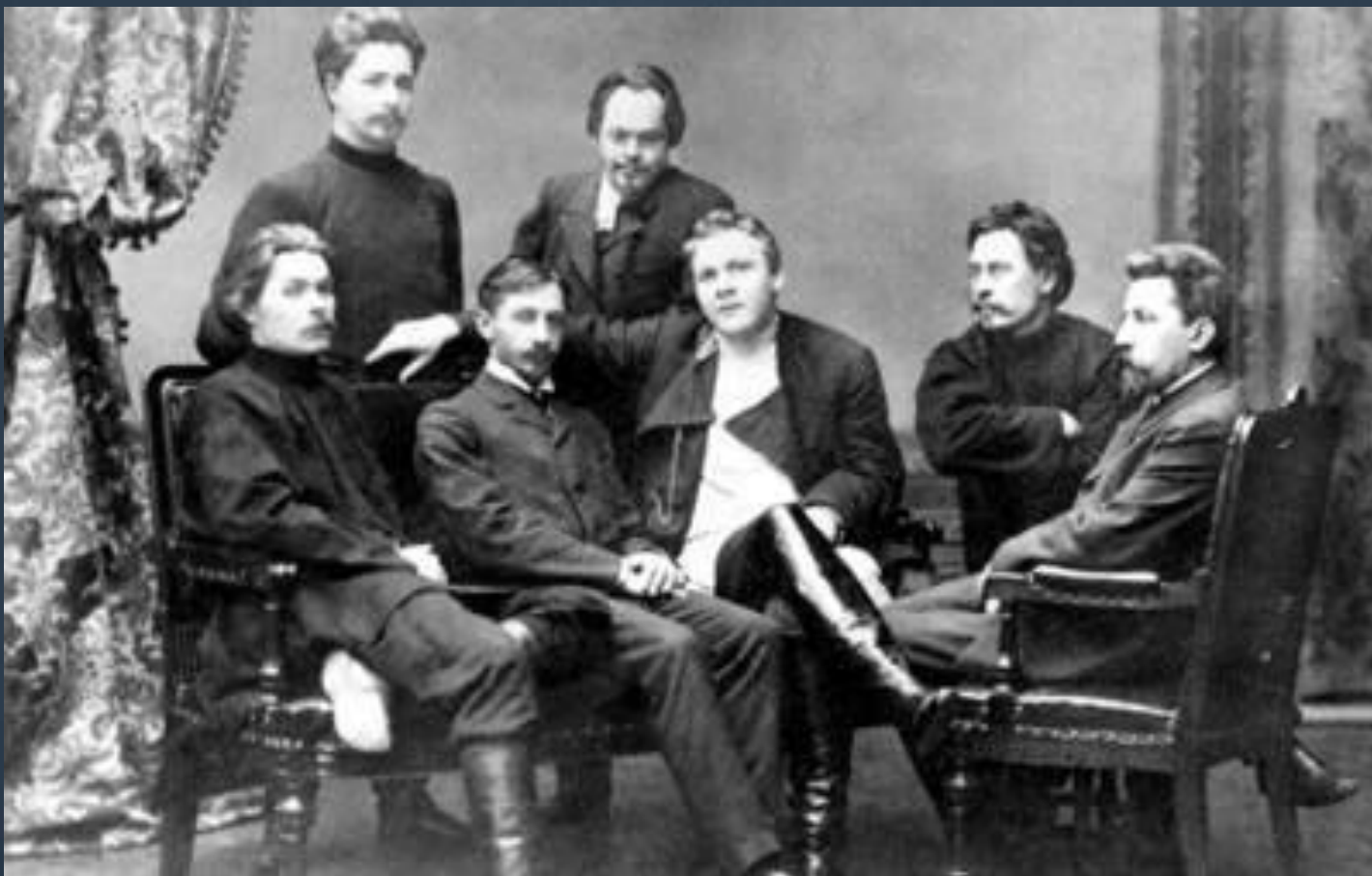
М. Горький, И. Бунин, Ф. Шаляпин. Скиталец (С. Петров), Н. Телешов, Л. Андреев, Е. Чириков.