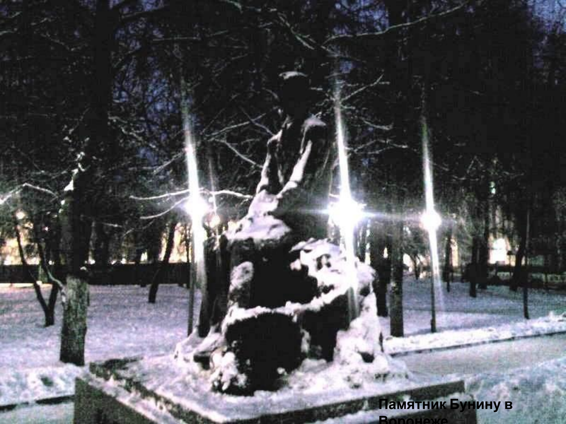
Памятник Бунину в Воронеже