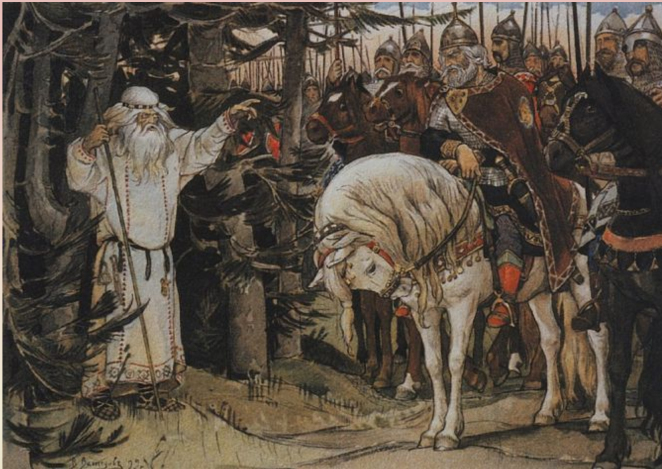
Встреча Олега с кудесником

Конец 1890-х годов был отмечен работой Васнецова над иллюстрациями к "Песне о вещем Олеге" Пушкина для академического издания к столетию со дня рождения поэта.