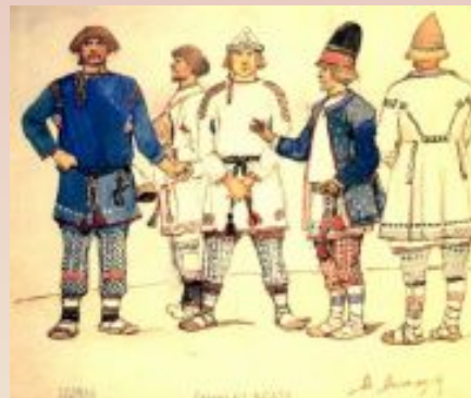
Брусила и берендеи ребята